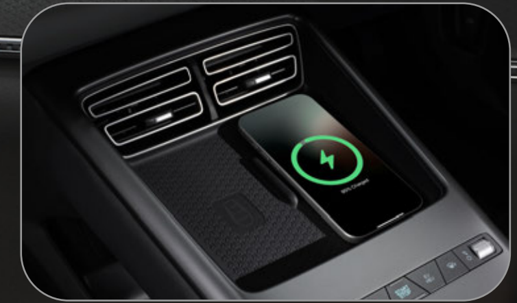
ที่ชาร์จโทรศัพท์แบบไร้สาย Wireless Charger