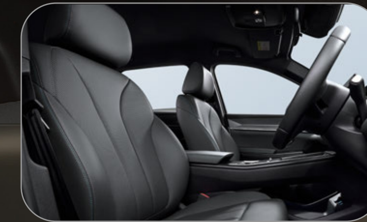
เบาะคู่หน้าแบบปรับไฟฟ้า และฟังก์ชันระบายอากาศ