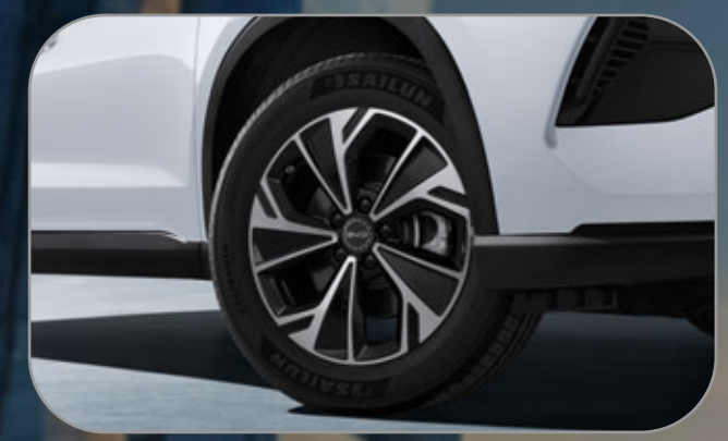
ล้ออัลลอยดีไซน์สปอร์ต ขนาด 18 นิ้ว