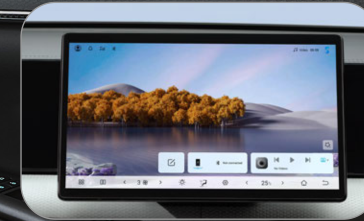
หน้าจอสัมผัสระบบมัลติมีเดีย ขนาด 12.8 นิ้ว

FVSR Front Vehicle Start Reminder ระบบเตือนเมื่อรถคันหน้าเริ่มเคลื่อนที่