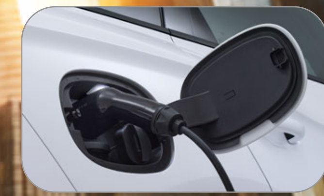
รองรับการชาร์จแบบ AC/DC Charger และระบบ VtoL พร้อมอุปกรณ์เสริม