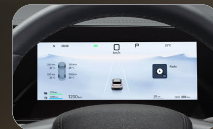
หน้าจอเรือนไมล์ ผู้ขับขี่แบบ LCD ขนาด 8.8 นิ้ว