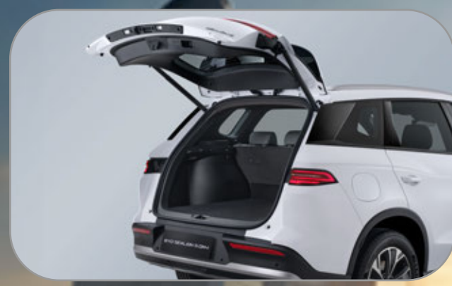
สะดวกไปอีกขั้นไปกับ ประตูท้าย เปิด-ปิด ระบบไฟฟ้า