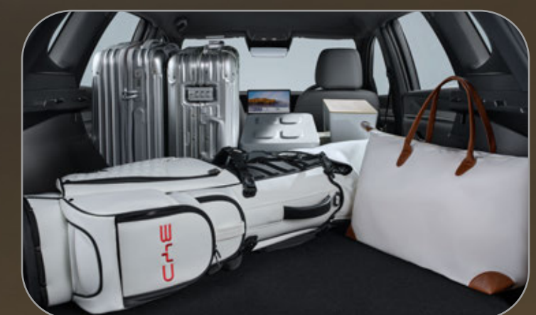
พื้นที่สัมภาระด้านท้าย จุได้ 1,482 ลิตร