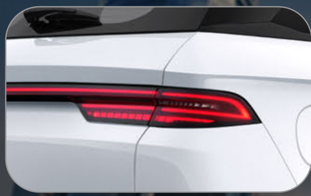
ไฟท้ายแบบ FULL LED พร้อมไฟเลี้ยวแบบ SEQUENTIAL