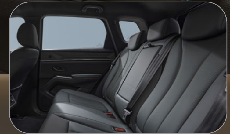
พื้นที่กว้างขวาง พร้อมวัสดุระดับพรีเมียม