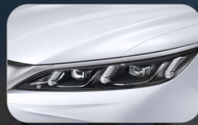
ไฟหน้าแบบ FULL LED ดีไซน์สุดพรีเมียม