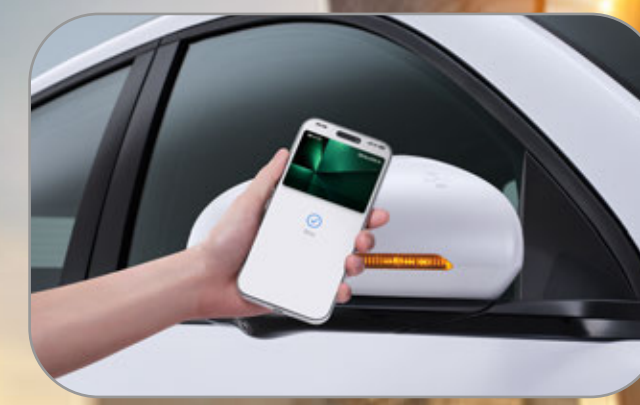
ปลดล็อกง่าย ด้วย BYD Digital Key / NFC Card