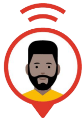
Référent Google Workspace (Vous)

Partagez votre lien de parrainage avec vos contacts ou les membres de votre réseau, et recevez des primes pour chaque parrainage réussi.