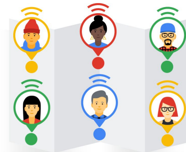
Utilisateur Google Workspace

Domaine parrainé ayant souscrit un abonnement Google Workspace payant.