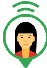
Client Google Workspace

Entreprise ou domaine parrainé par vous. Vous pouvez parrainer un nombre illimité de bénéficiaires.