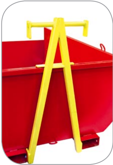
Krokpigg (tilbehør) Gaffelkasser foran