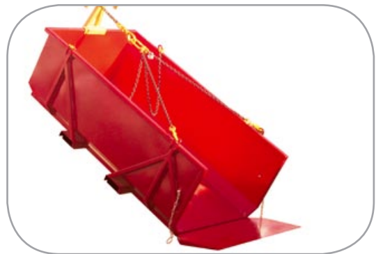
4-delerskjetting for sikker transport og tømming