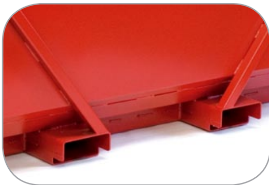
Gaffelkasser på langsiden Spor for stablemulighet