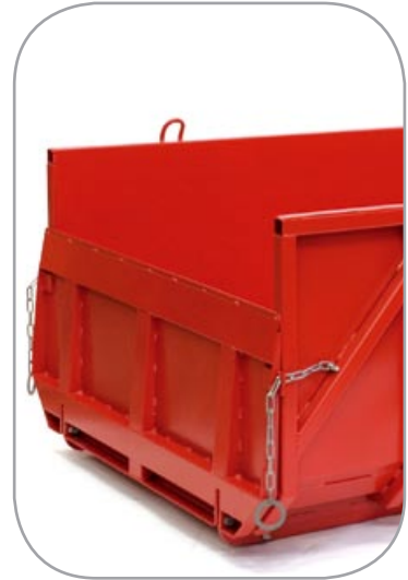
Opplåsbar lem med låse- kjetting (tilbehør)