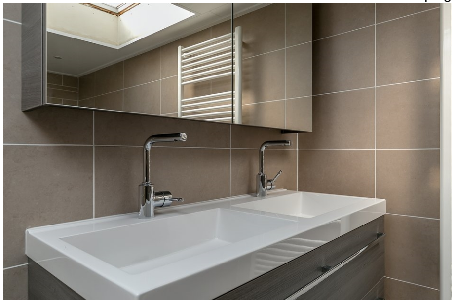
badkamer eerste verdieping