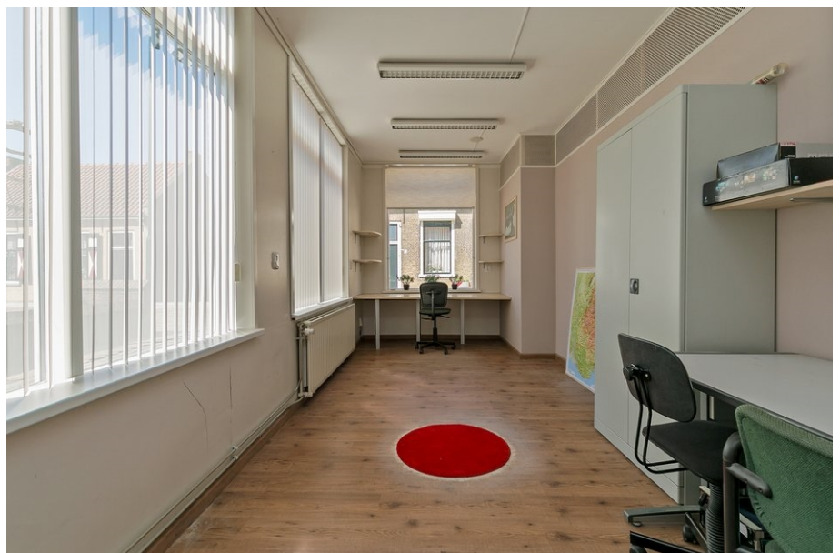
bedrijfsruimte - kantoor