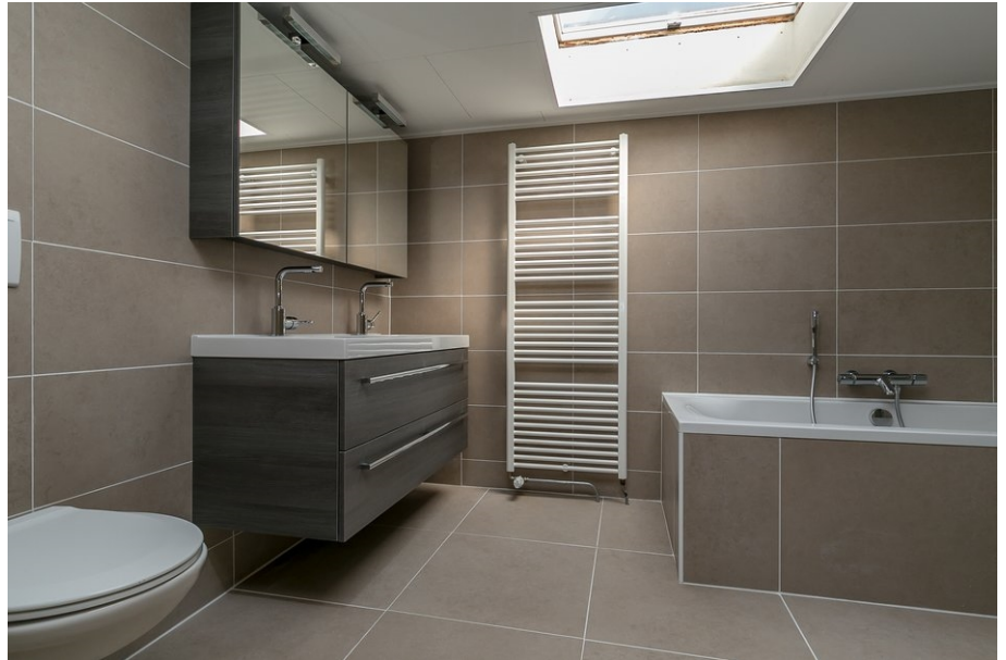
badkamer eerste verdieping

Kantoor Puttershoek Pieter Repelaerstraat 61B 3297 BL Puttershoek T 078-6736255 F 078-6736230