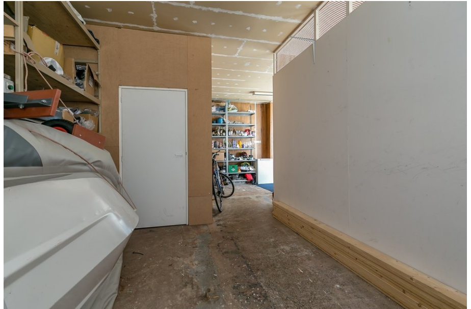
bedrijfsruimte - werkplaats

Kantoor Puttershoek Pieter Repelaerstraat 61B 3297 BL Puttershoek T 078-6736255 F 078-6736230