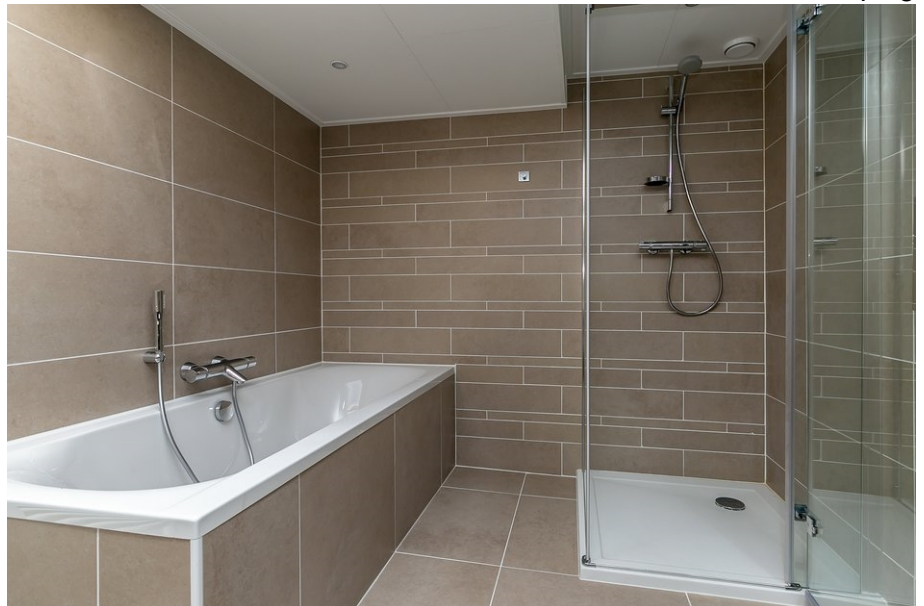
badkamer eerste verdieping