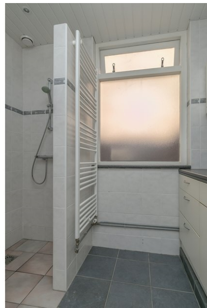
badkamer begane grond - bij bijkeuken