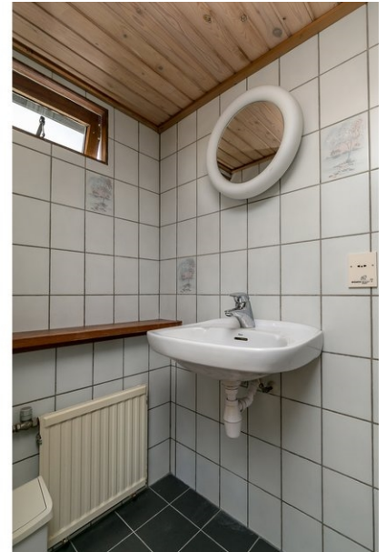
badkamer eerste verdieping - bij slaapkamer 1