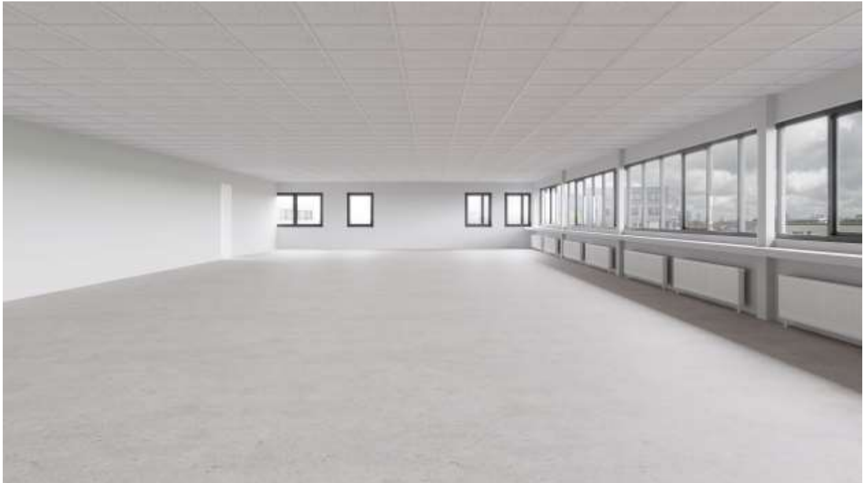
Bovenstaande foto is een impressie foto van de te renoveren ruimtes.