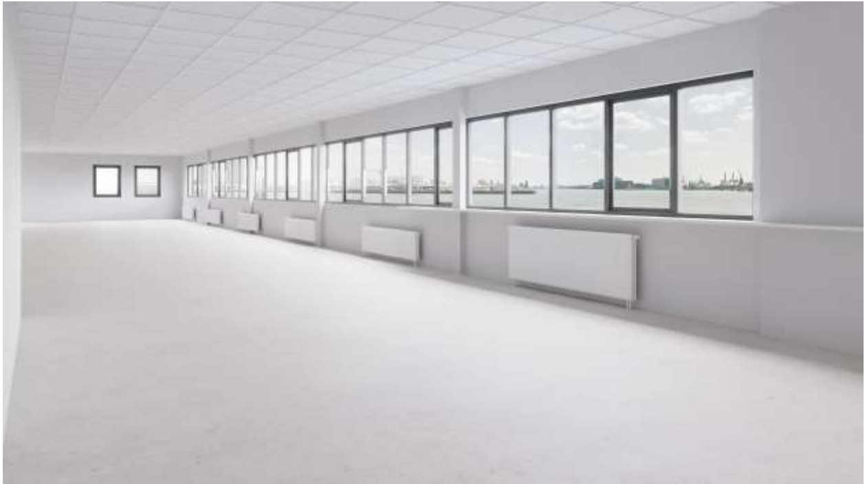
Bovenstaande foto is een impressie foto van de te renoveren ruimtes.