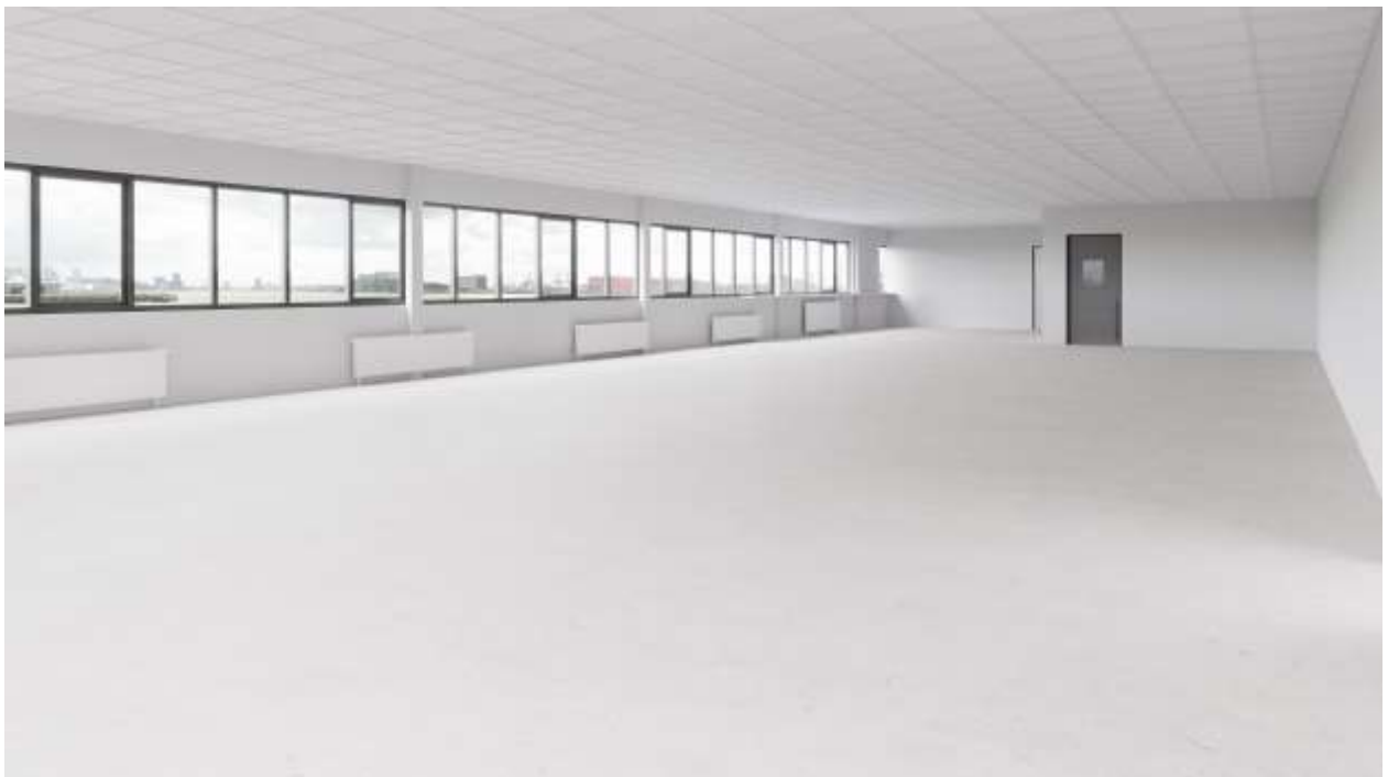
Bovenstaande foto is een impressie foto van de te renoveren ruimtes.