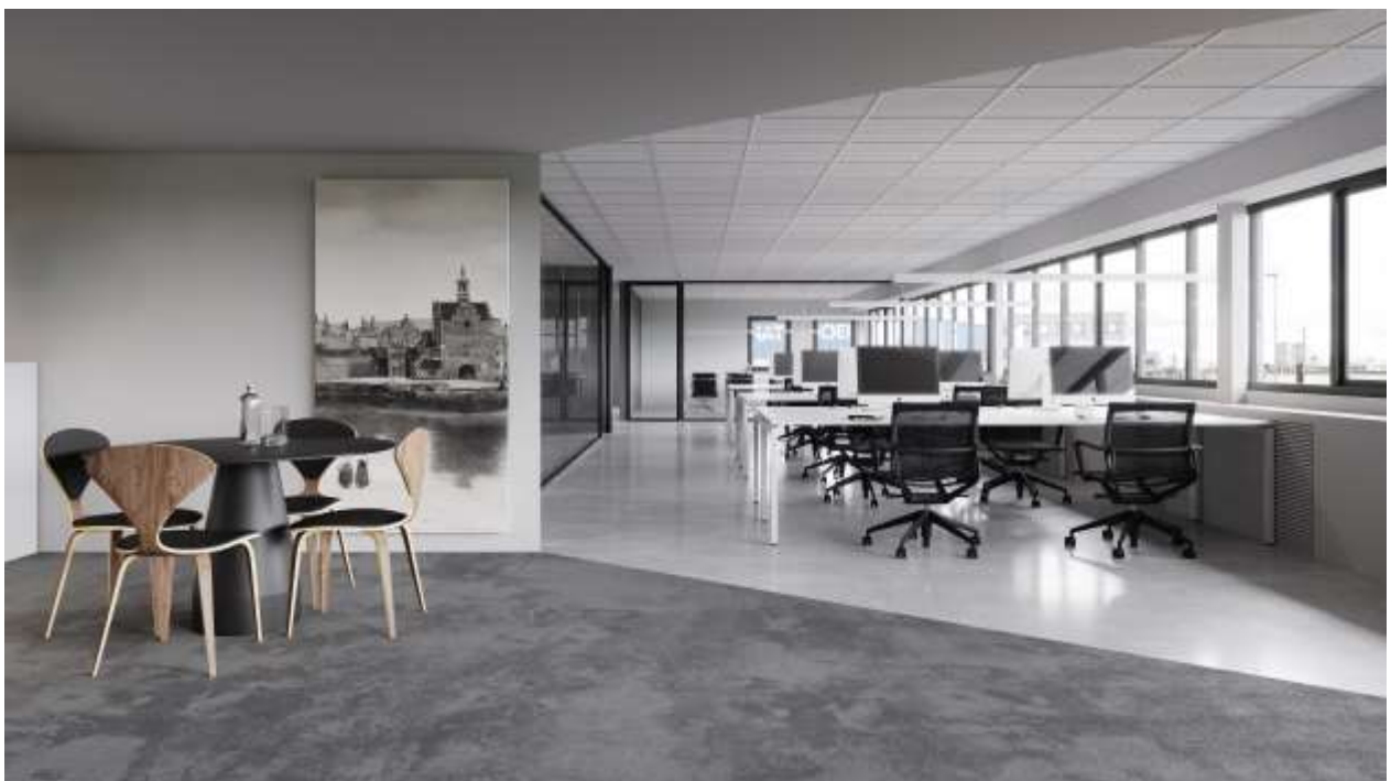
Bovenstaande foto is een impressie foto van de te renoveren ruimtes.