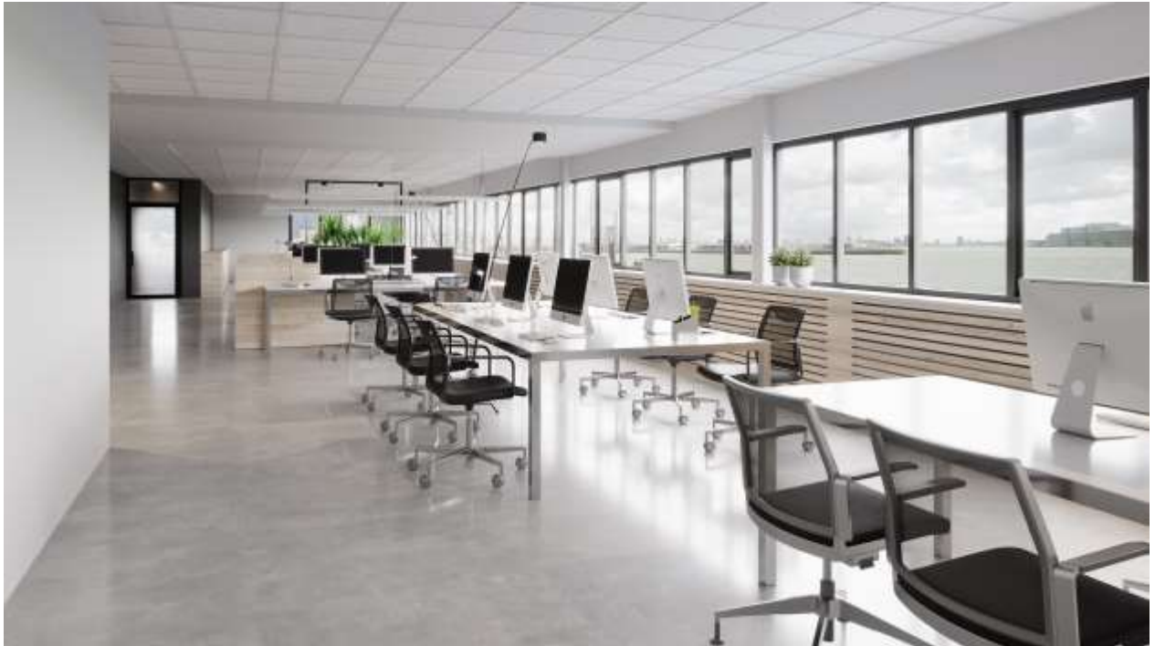
Bovenstaande foto is een impressie foto van de te renoveren ruimtes.