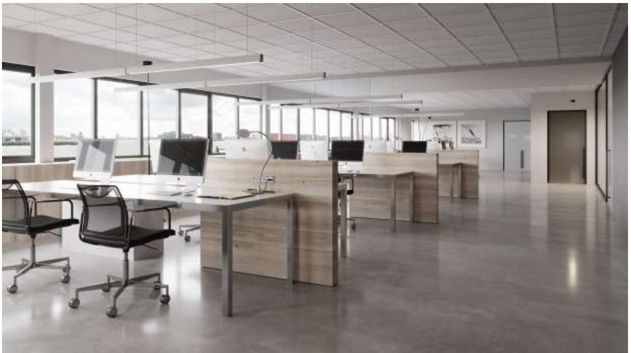
Bovenstaande foto is een impressie foto van de te renoveren ruimtes.