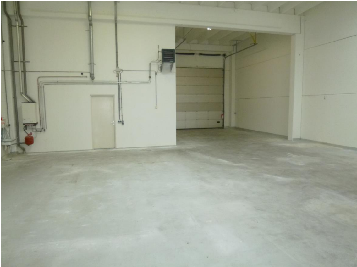
Bovenstaande foto betreft een vergelijkbaar object.