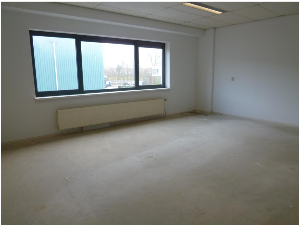
Bovenstaande foto betreft een vergelijkbaar object.