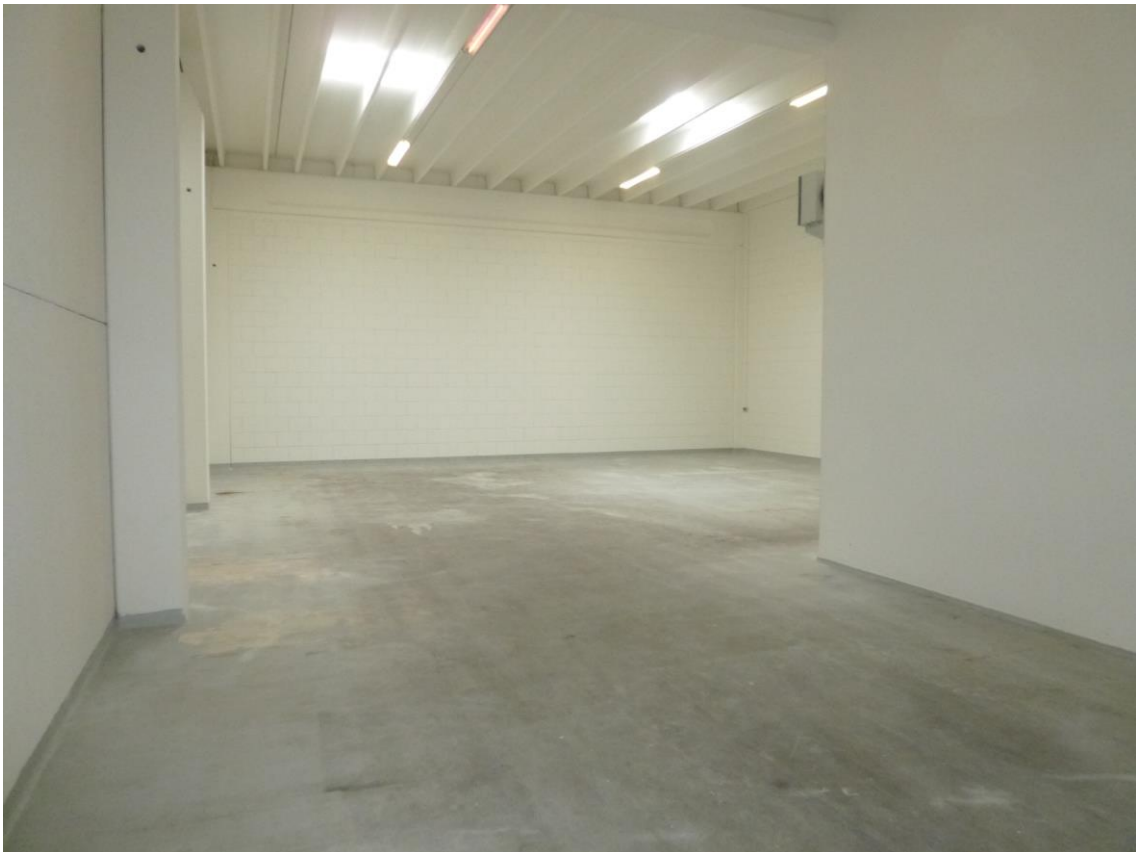
Bovenstaande foto betreft een vergelijkbaar object.