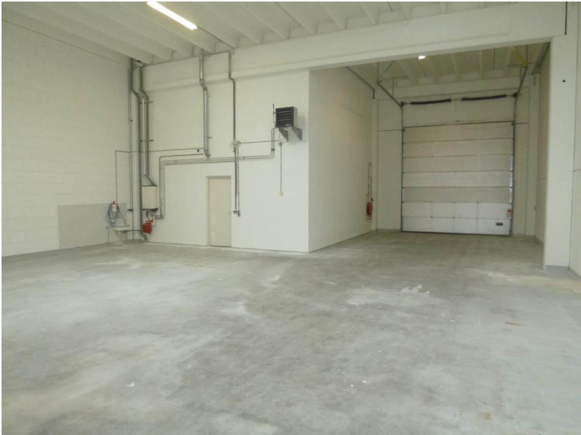
Bovenstaande foto betreft een vergelijkbaar object.