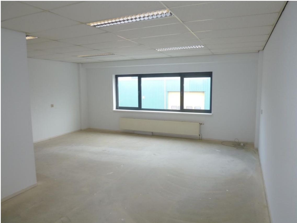
Bovenstaande foto betreft een vergelijkbaar object.