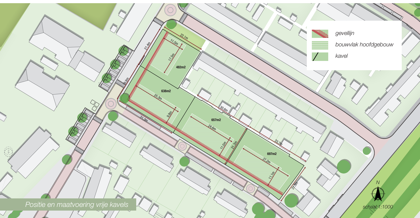
Positie en maatvoering vrije kavels