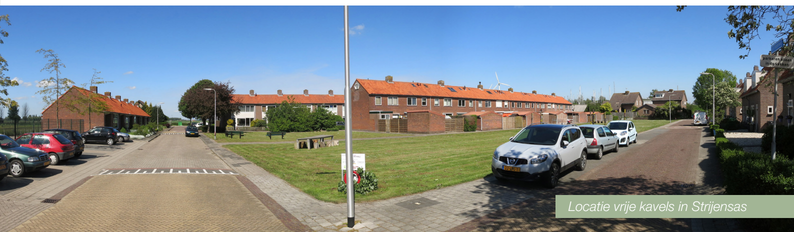
Locatie vrije kavels in Strijensas