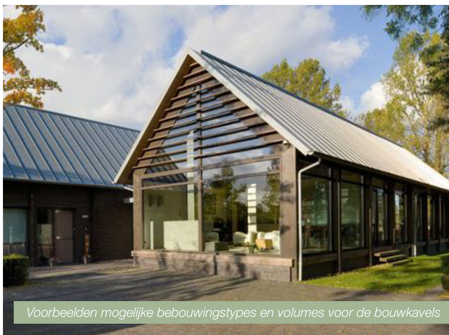
Voorbeelden mogelijke bebouwingstypes en volumes voor de bouw kavels