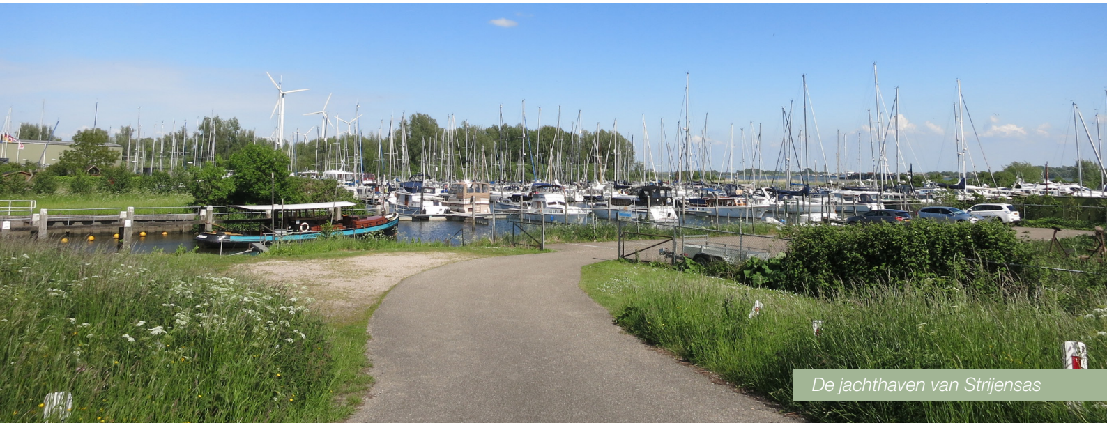
De jachthaven van Strijensas