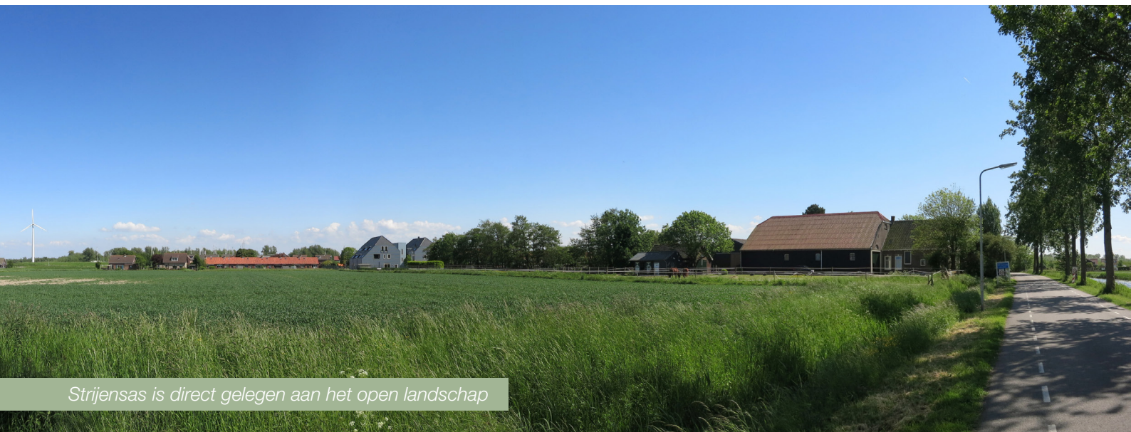
Strijensas is direct gelegen aan het open landschap

Kenmerkend aan Strijensas is de grote hoeveelheid historische bebouwing van rond 1900. De kern van het dorp is gelegen rondom de Strijense Haven welke door het dorp loopt en via de oude sluis uitkomt in het Hollands Diep. Enkele oude boerderijen van bijna een eeuw oud maken het beeld compleet.