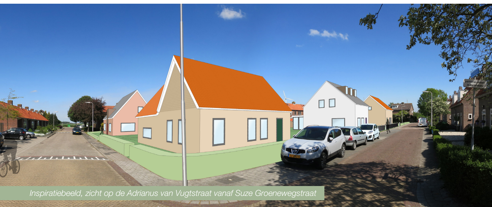
Inspiratiebeeld, zicht op de Adrianus van Vugtstraat vanaf Suze Groenewegstraat