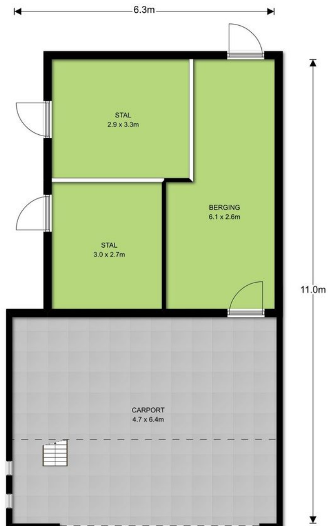
Begane grond, Wellenseind 6 te Lage Mierde De plattegronden zijn ter indicatie en geproduceerd voor promotionele doeleinden. Aan de plattegronden kunnen geen rechten worden ontleend. © topr.nl