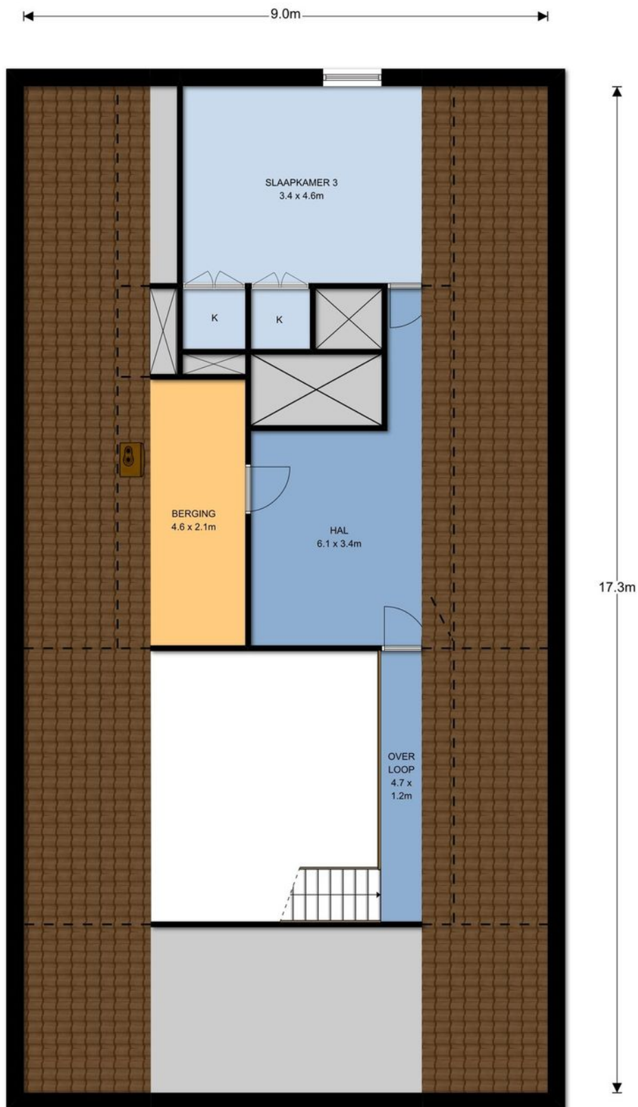
1e Verdieping, Wellenseind 6 te Lage Mierde De plattegronden zijn ter indicatie en geproduceerd voor promotionele doeleinden. Aan de plattegronden kunnen geen rechten worden ontleend. © topr.nl