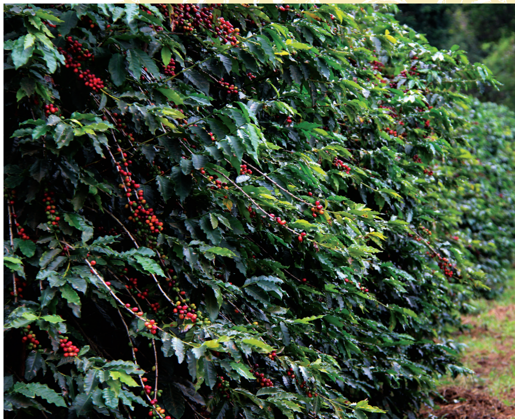
Cafezal do Instituto Biológico