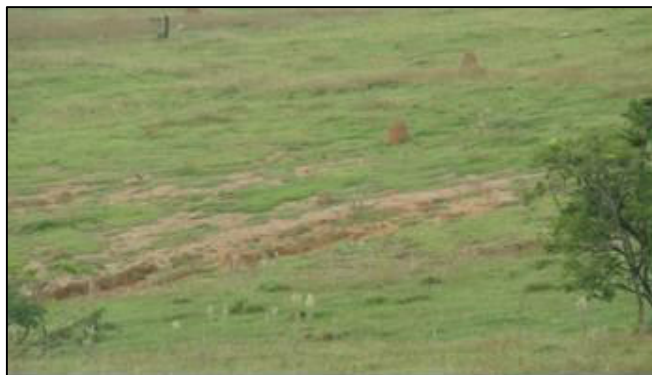
Figura 7 – Pastagem com erosão em Tatuí, Abril de 2010.