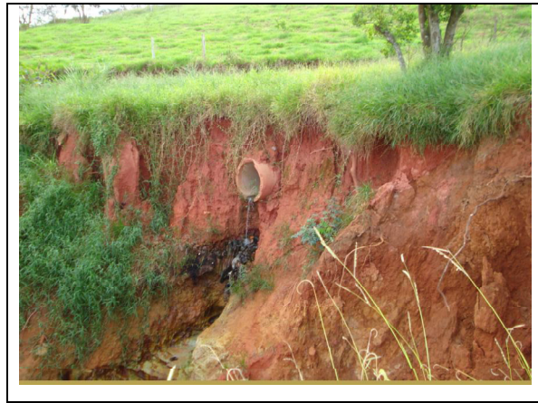
Figura 9 – Efluentes domésticos sem tratamento e com descarte inadequado.

Cita-se também, a transferência de “sem tetos” em área de APP do Bairro Gramado para o município de Tatuí, no Bairro Tomas Guedes, gerando lixo, entulho e efluentes domésticos sem tratamentos para a APP do Rio Tatuí, como nas fotos.