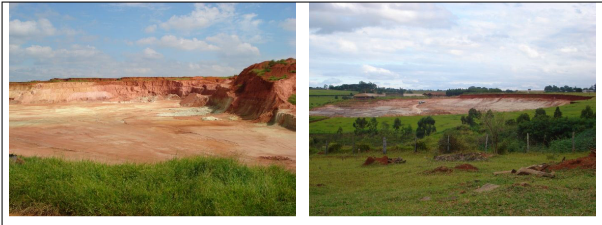
Figura 11 – Aspecto geral de área de mineração de argila.

As principais características, no contexto ambiental são: