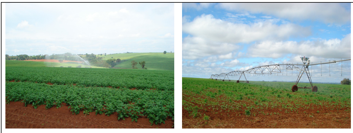
Figura 17 – Manejo adequado da irrigação.

Nesta zona de transição, embora tenham sido observados vários pontos com utilização de irrigação em culturas diversas, não foram detectados problemas ambientais (Figura 17). Em situações pontuais, áreas cultivadas com cana apresentam danos em estrada rural, devido a rompimento de terraços.