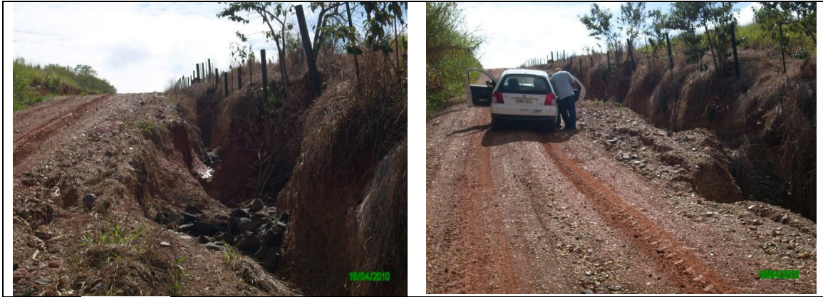
Figura 23 – Voçoroca associada a drenagem inadequada de estradas rurais.