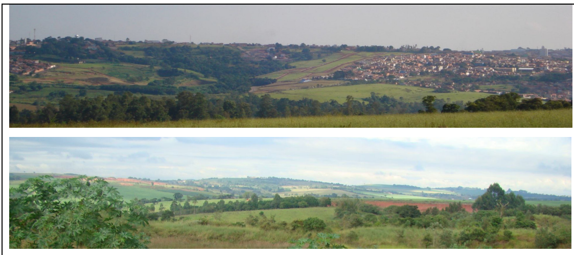
Figura 20 – Vista típica da declividade predominante do município.

O mapa de Classes de Declividade traduziu o comportamento das vertentes do município quando reclassificado em quatro classes de domínio, conforme Tabela 17, sendo a de maior abrangência, relativa ao intervalo entre 2 a 10% de declive, equivalendo a 85,81% do total da área, o que está completamente de acordo com sua morfologia. Isso a caracterizou como de domínio Suave Ondulado (Figura 20).