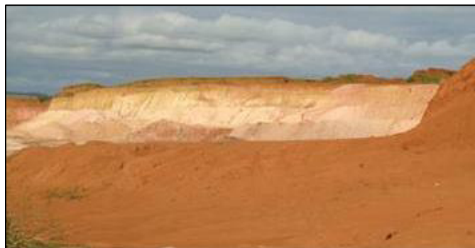
Figura 6 - Barreiro em Tatuí, Abril de 2010.