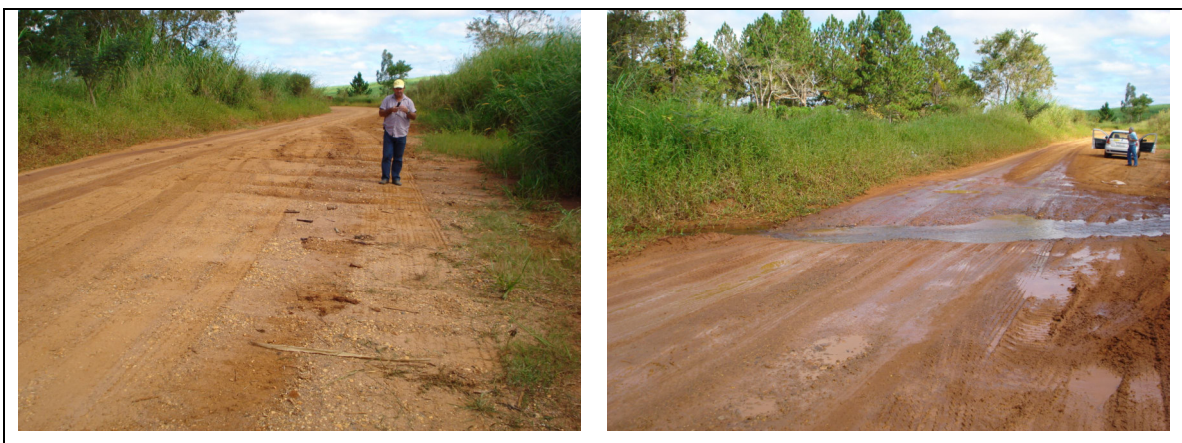
Figura 22 – Problemas em estradas vicinais (trepidação – costela de vaca e inexistência de canal subterrâneo).

As lombadas, importantes para o controle da velocidade das águas na superfície de rodagem, deverão estar dispostas em harmonia com a disposição dos terraços existentes nas áreas agrícolas adjacentes, ou seja, executando-as obedecendo-se aos mesmos espaçamentos.