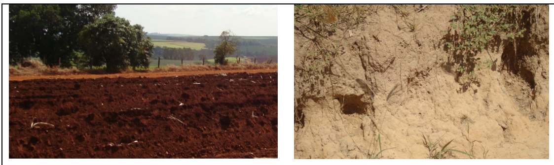
Figura 4 – Solos típicos do município, grupo dos Latossolos e Argissolos respectivamente.

O grupo dos Argissolos (vermelho-amarelo e outros tipos), ocupam 19,39% da área agrícola do município e se concentram numa faixa estreita, que se estende da Rodovia Castelo Branco até a confluência do Rio Sorocaba com o Rio Sarapuí, seguindo suas margens no sentido a Itapetininga.