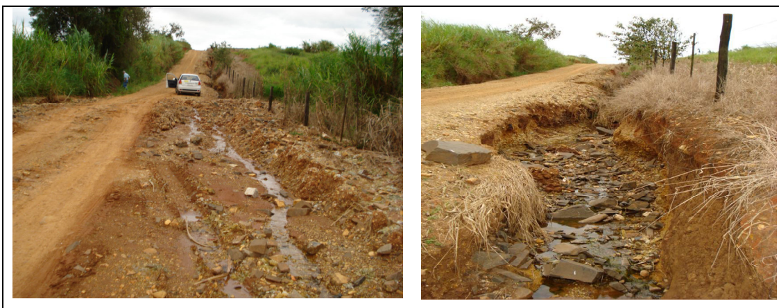
Figura 21 – Laterais de estradas funcionando como canais escoadouros com arraste intenso de partículas.

Com a adequação das estradas e a construção de lombadas, terraços, caixas de captação, bueiros e revestimento primário haverá uma considerável redução do volume das águas pluviais no leito e sedimentos que chegam às nascentes e cursos d'água, reduzindo-se assim o seu assoreamento.