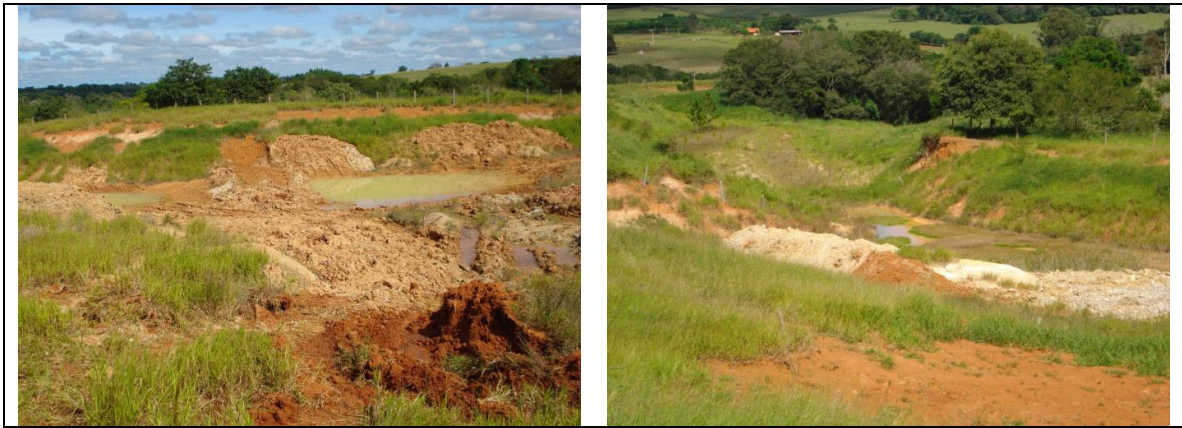
Figura 12 – Área após a atividade de mineração de argila.