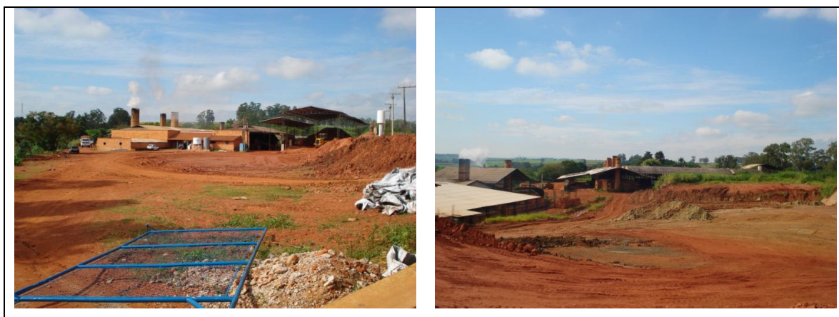
Figura 10 – Vista geral de Cerâmicas de produção de tijolos e telhas.

A mineração de argila é atividade comum no município de Tatuí, gerando matéria prima para cerâmica, tijolos e telhas (Figura 10), fonte importante de degradação ambiental (Figura 11).