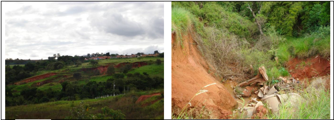
Figura 25 – Voçoroca provocada por má condução das águas pluviais em loteamento urbano.

A CATI, através do Programa Estadual de Microbacias Hidrográficas (2000 a 2008), proporcionou a capacitação dos técnicos para o reconhecimento e a elaboração de projetos técnicos para recuperação e controle dessas grandes erosões. O impacto ambiental não se resume aos imensos “buracos” formados na área de cultivo. O solo arrastado pela enxurrada é depositado nas baixadas onde se encontram as águas das nascentes, dos córregos e dos rios, tornando-as poluídas com partículas de solo, fertilizantes, matéria orgânica e defensivos agrícolas. Além disso, a quantidade das águas diminuiu consideravelmente com o entupimento de nascentes pelo assoreamento. A voçoroca se torna ainda mais crítica quando alcança o lençol freático, provocando o surgimento de um novo córrego que, geralmente, provoca a queda de barrancos – fenômeno do piping , ao longo desse processo erosivo.