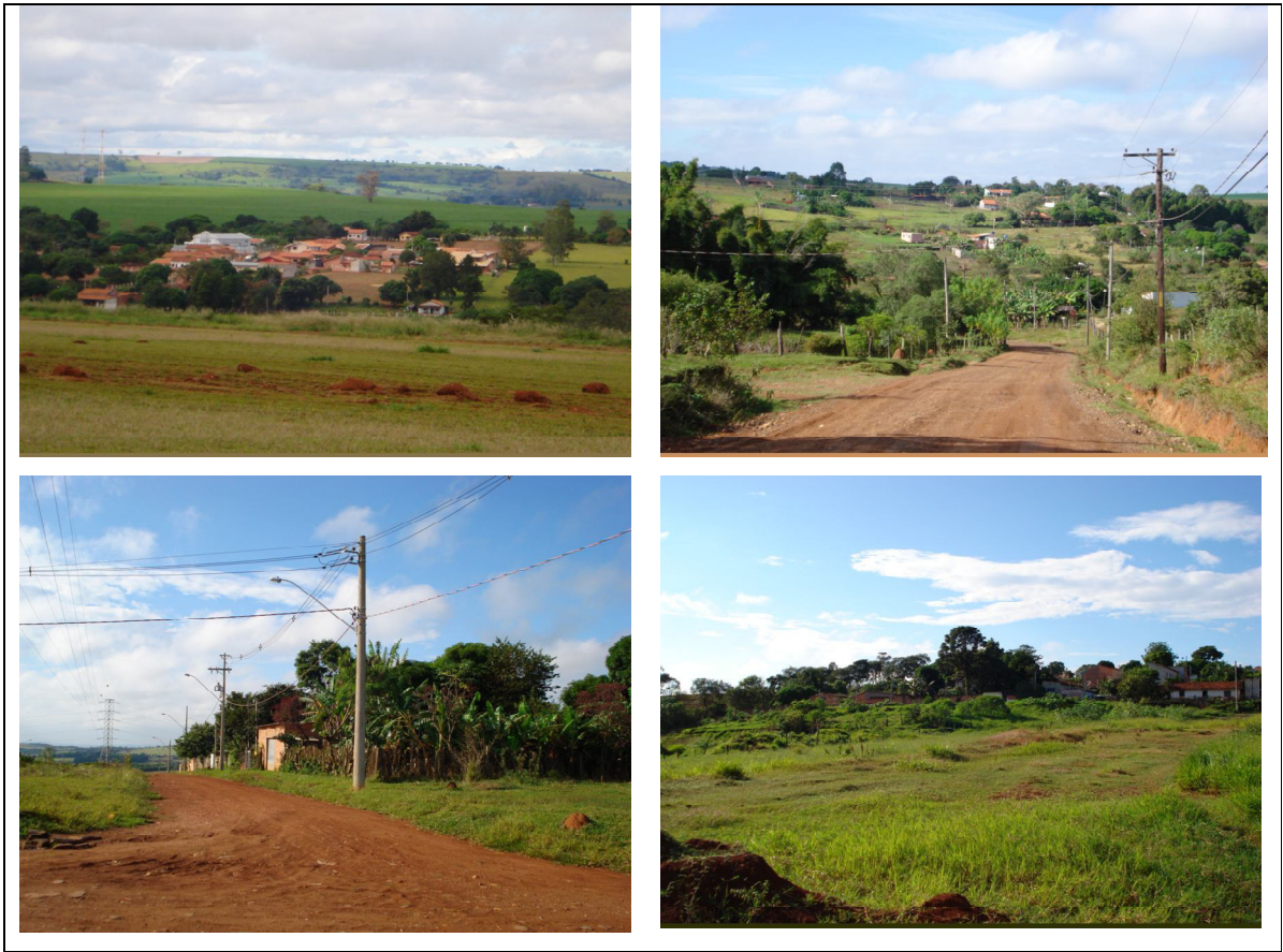
Figura 8 - Aglomerados urbanos limítrofes à área rural.

Cita-se também, a transferência de “sem tetos” em área de APP do Bairro Gramado para o município de Tatuí, no Bairro Tomas Guedes, gerando lixo, entulho e efluentes domésticos sem tratamentos para a APP do Rio Tatuí, como nas fotos.