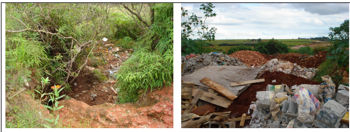
Figura 15 – Poluição visual e ambiental.