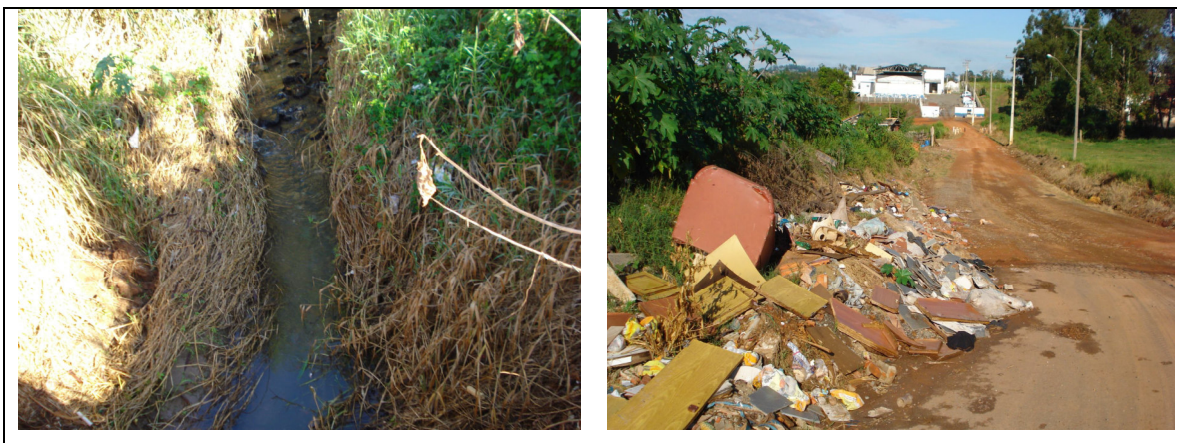
Figura 16 – Córrego poluído e descarte de lixo em local inadequado.