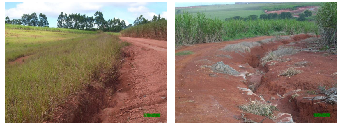
Figura 24 – Formação de voçoroca pela condução inadequada das águas em terraços/ carregadores de cana.