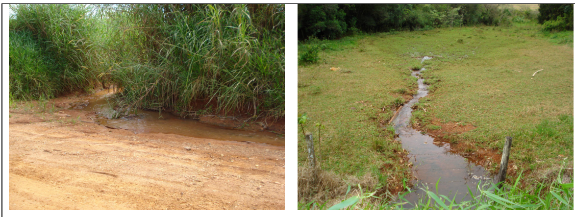
Figura 19 – Ausência de vegetação ciliar em córregos de pequeno porte.

No entanto, os pequenos córregos não apresentam essa situação, sendo comum em muitos casos a inexistência da vegetação de proteção (Figura 19).