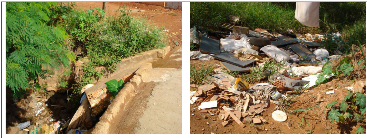
Figura 14 – Entupimento dos sistemas de escoamento de água.

A composição do lixo é bastante diversa, muitas vezes observando-se a presença de entulho de construção, plástico, metal, materiais orgânicos (restos de animais, restos de alimentos), papel, entre outros diversos resíduos produzidos pela sociedade atual.