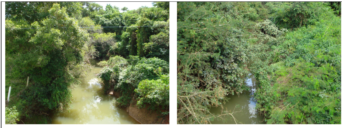
Figura 18 – Vegetação ciliar nos córregos de porte médio a grande.

De maneira geral podemos observar a presença de vegetação ciliar nos córregos de porte médio a grande (Figura 18).