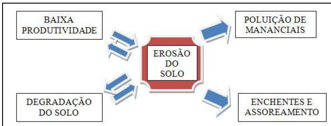
Figura 3 – Erosão e seus efeitos nos recursos naturais.

De forma direta, a erosão, além das perdas econômicas, promove ao longo do tempo a degradação de áreas extensas, inviabilizando a continuidade do aproveitamento agrícola das mesmas. Em função disto, tais áreas acabam abandonadas, influenciando inclusive nos preços atribuídos às propriedades rurais.