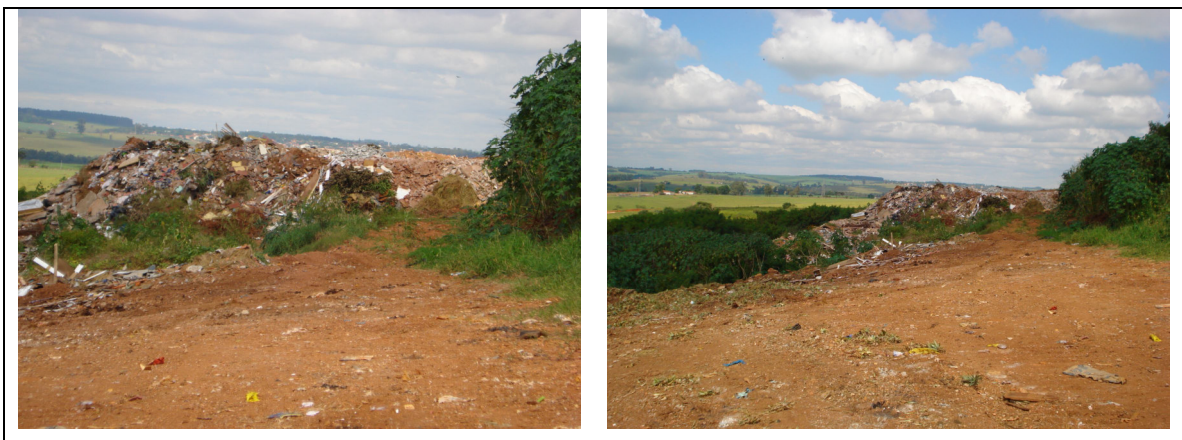
Figura 13 – Aterro sanitário municipal.