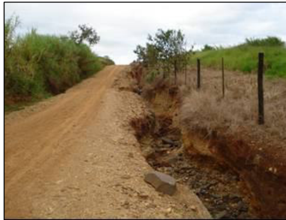
Figura 5 - Erosão em estrada vicinal em Tatuí, Abril de 2010.