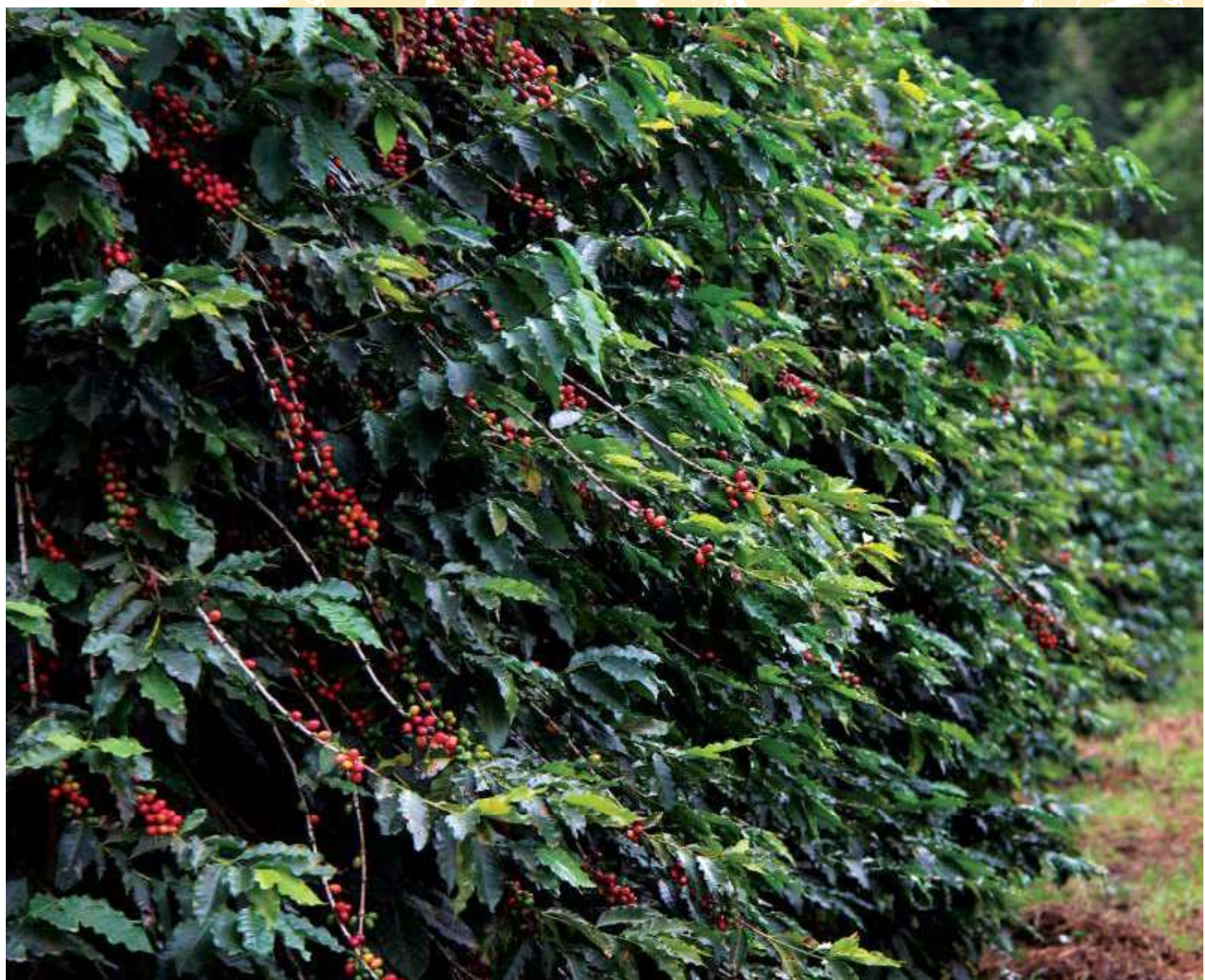
Cafezal do Instituto Biológico