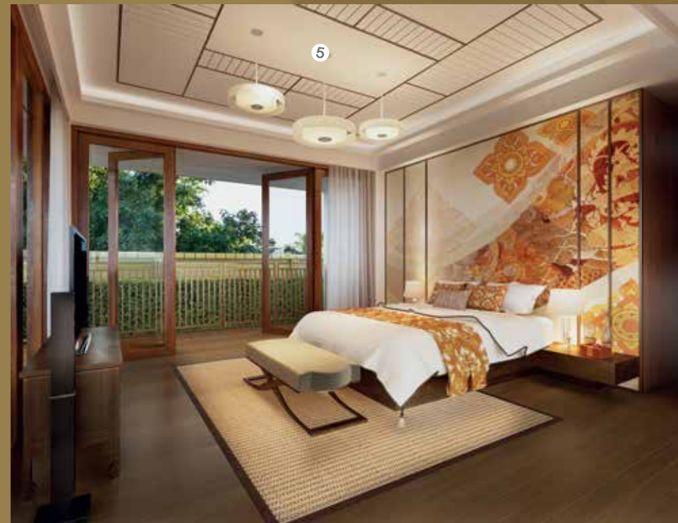
ภายในห้องนอน ให้ความรู้สึกแบบเรือนไทย ด้วยพื้นไม้ และเพดานเล่นสลับลาย