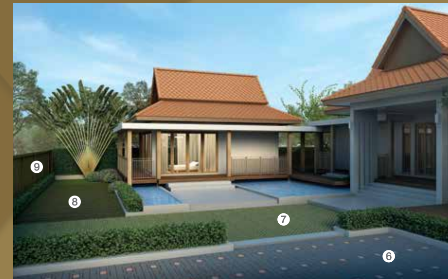
พื้นที่ภายนอกบ้าน เน้นชานบ้านกว้าง และปูด้วยวัสดุไม้ผสมผสานกับปูน