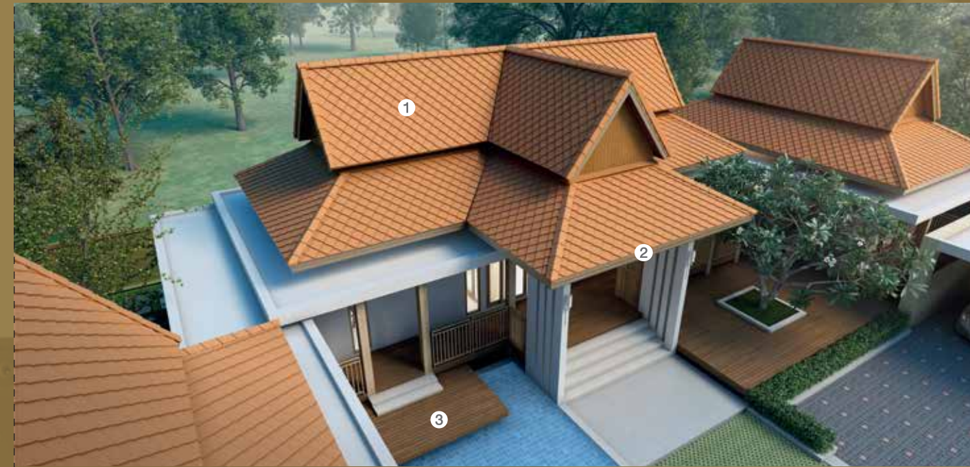
หลังคาปูด้วยกระเบื้องทรงว่าว และมีชานกว้างเปิดรับลม คงวิถีชีวิตแบบไทย แต่สะดวกสบายเข้ากับยุคสมัย