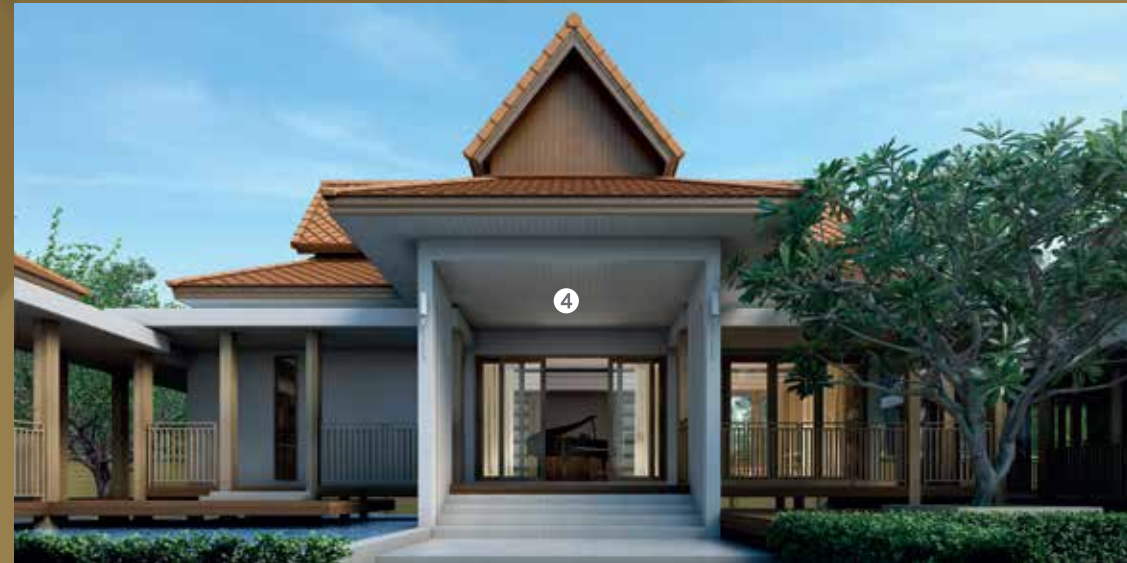
ออกแบบโดยนำทรงของเรือนไทยมาประยุกต์เข้ากับการก่อสร้างแบบก่ออิฐฉาบปูน