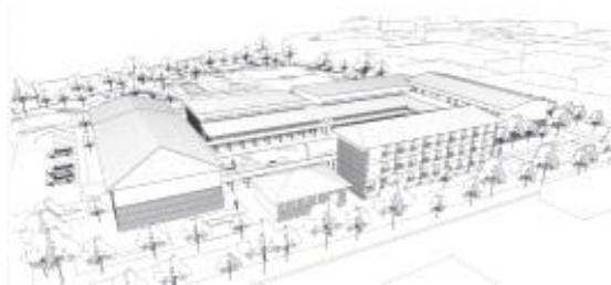
■ 그림1 렌더링하지 않은 3차원 이미지 예시