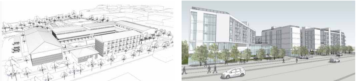
■ 그림1. 렌더링하지 않은 3차원 이미지 예시 >

출처 : 국가공공건축지원센터, 공공건축 설계발주 가이드(Ver.2), p.22-23 (2018.12.)