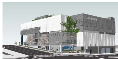
노형동 710-4번지 공영주차장 복층화사업 설계공모 당선작