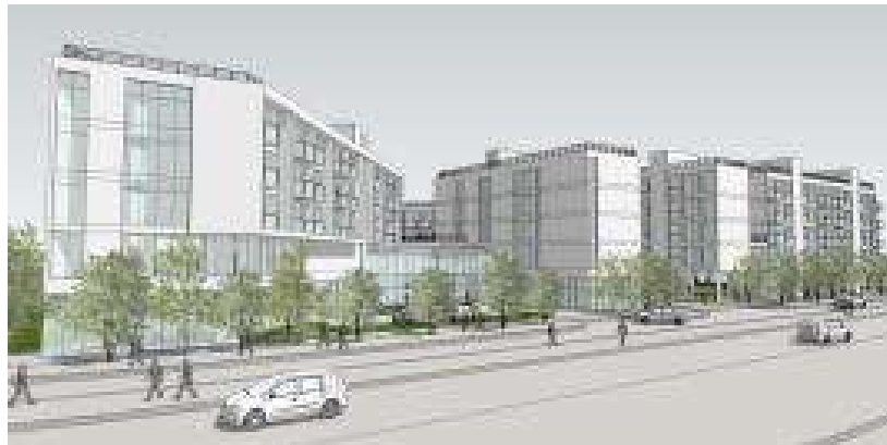
출처 : 국가공공건축지원센터(2014) 공공건축 설계발주 가이드 p.23