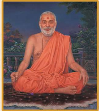
Bhramswarup Pramukh swami Maharaj