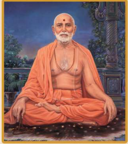
Bhramswarup Shastriji Maharaj