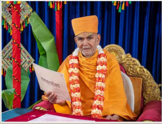
Pragat Brahmaswarup Mahant Swami Maharaj