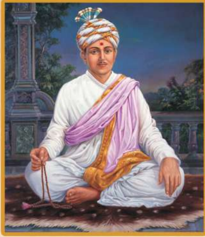
Bhramswarup Bhagatji Maharaj