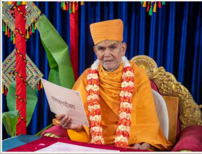
Pragat Brahmaswarup Mahant Swami Maharaj