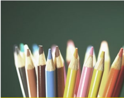
Avoim AMK, yksittäiset opintojaksot | Opinto-opas