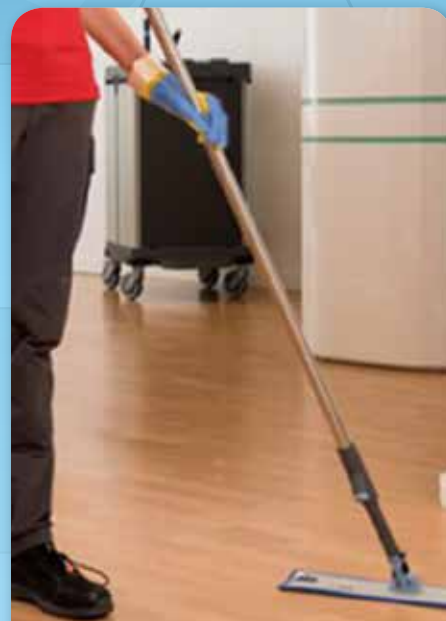
53496 BAYETA MICROFIBRA STYLE P4 C16

SISTEMAS FREGADO EN PLANO, UN SOLO USO VILEDA