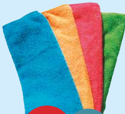
53082 BAYETA BREAZY AZUL 35X35 R25C12 C/12 Retrácil 25