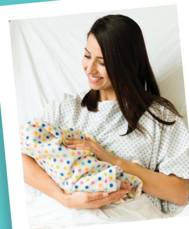
نظرة العنانة الأوليكم

نرحب بوجود الزوج أو أحد أفراد الأسرة داخل غرفة الولادة، لتقديم الدعم خلال هذه اللحظات المميزة.