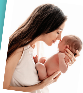
أول مظهر عائلتي

نحن نضع سلامة الأم وراحة بالها في صميم أولوياتنا. وتتضمن بيئتنا الآمنة نقاط دخول خاضعة للرقابة، مما يضمن دخول الأفراد المصرح لهم والزوار المسجلين فقط إلى مناطق الولادة. ونستعين بالتقنيات المتقدمة مثل أساور أمان الأطفال المرتبطة إلكترونياً بوالديهم، مما يوفر حماية إضافية طوال فترة الإقامة بالمستشفى. وهناك موظفو أمن جاهزون دائماً لمساعدة الأم والعائلة، فيما يقدمون لهم الدعم والأمان.