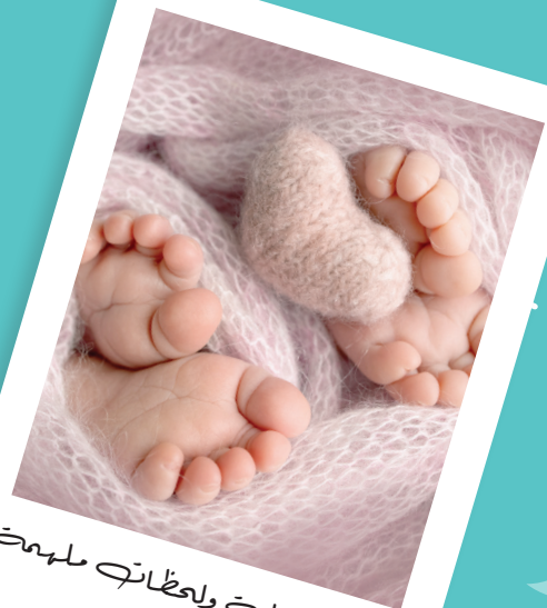
أصابع ضئيلة ولحظاتي مليحة

إذا كانت حالة الأم مناسبة من الناحية السريرية، فيمكنها ولادة التوائم ولادة طبيعية، مصحوبة بالمراقبة الدقيقة والإرشادات المتخصصة.