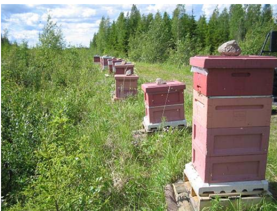
Kuva 2. Hunajatupa: Väinö Kuivalaisen mehiläistarhat Räimän kylällä.

Kyläläisten laatima yritys- ja palveluluettelo on liitteessä 2. Siilinjärven kunnan yritysluettelosta voi poimia lisätietoja myös Räimällä toimivista yrityksistä. ( www.siilinjärvi.fi/yritykset/yrityshakemisto/yrityshakemisto.php )