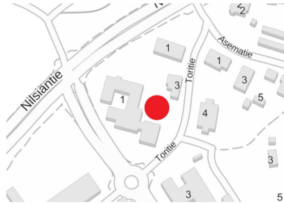
Kartta 2. Vedenjakelupaikan sijainti.