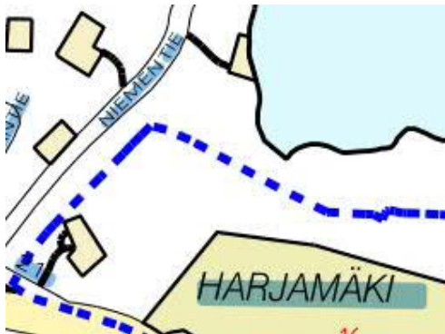
Kartta 1, tarkennos. Pääkartalta puuttuva kulma.