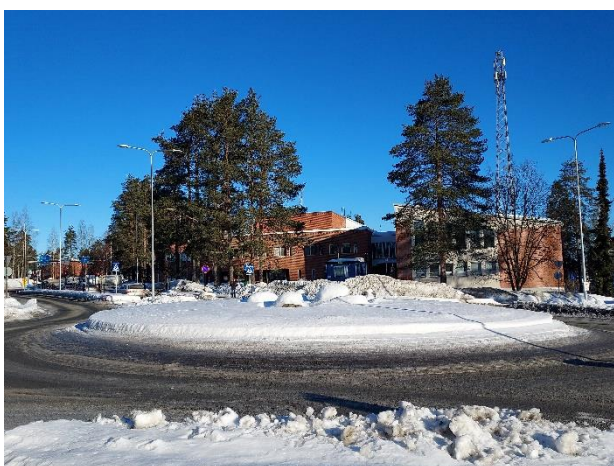
Kuva 1. Näkymä koilliseen, taustalla käytöstä poistuva kunnantalo

Edellä kuvatun rakennuskannan uudistumisen myötä kiertoliittymään tulevan taideteoksen miljöö tulee muuttumaan merkittävästi tulevaisuudessa. Luonnostilausvaiheessa taiteilijalle toimitetaan havainnekuvat kiertoliittymän ympäristöön suunnitelluista rakennusmassoista, jotta teosta luonnostellessa pystytään huomioimaan myös sen sopiminen tulevaisuuden ympäristöön.