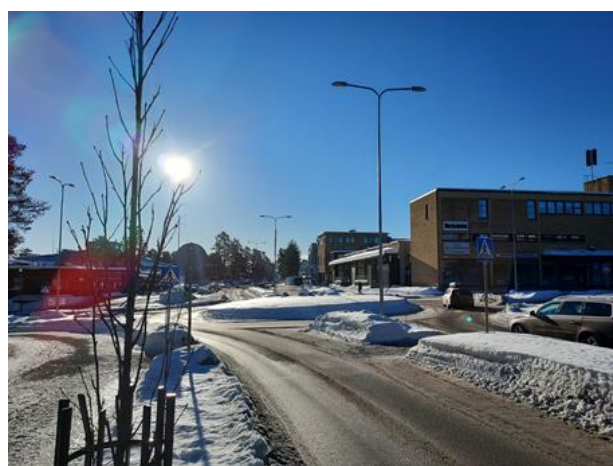
Kuva 2. Näkymä etelään, oikealla liikekortteli. Vasemmalla vanha ja uusi tk.