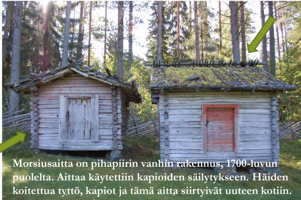
Morsiusaitta on pihapiirin vanhin rakennus, 1700-luvun puolelta. Aittaa käytettiin kapioiden säilytykseen. Häiden koitettua tyttö, kapiot ja tämä aitta siirtyivät uuteen kotiin.

Voi oli Pöljän tärkein vientituote (ei terva) ja arvostettua pöljäläistä voita on viety pitkienkin matkojen päähän vesireittejä hyväksi käyttäen. Juustoa ei savolaisasutuksen alueella valmistettu.