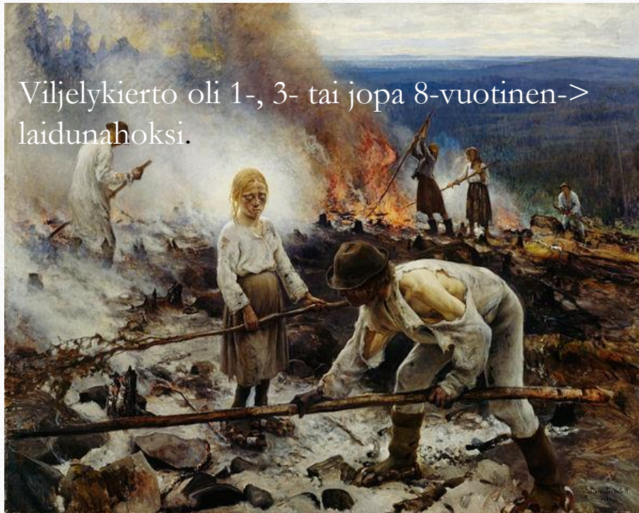
Eero Järnefelt: Raatajat rahanalaiset, 1893

Viljelykierto oli 1-, 3- tai jopa 8-vuotinen -> laidunahoksi.