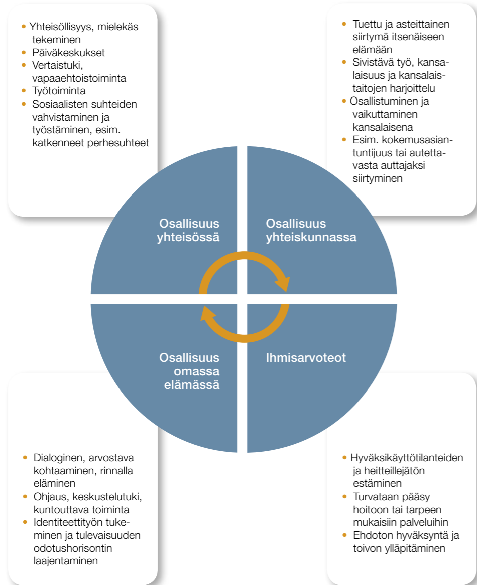
Kuvio 5. Osallisuuden hyvää kehää edistäviä käytäntöjä ja työmuotoja kristillisissä päihdejärjestöissä.

Kuvio 5 konkretisoi vielä osallisuuden hyvää kehää edistäviä arkisia käytäntöjä ja työmuotoja, joita kuhunkin sen vaiheeseen liittyy ja joita on tämän artikkelin asiakas-tapausten esittelyissä eri luvuissa kuvattu.