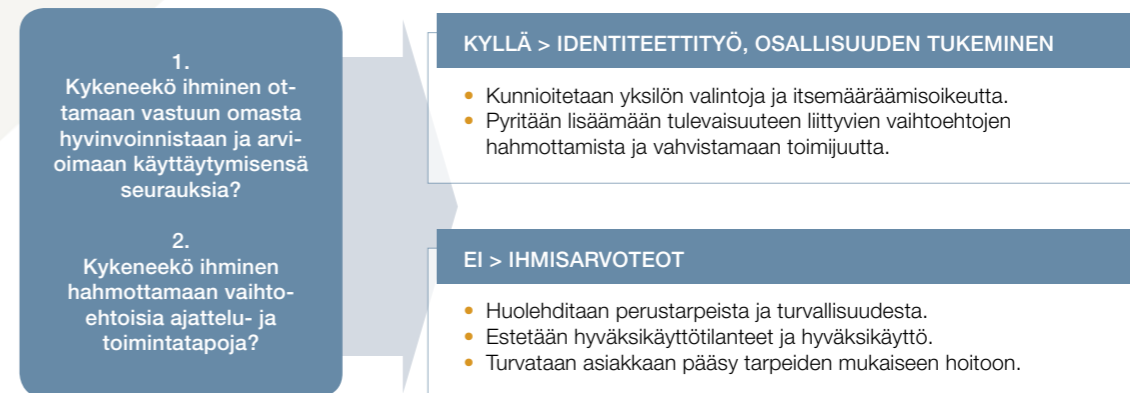
Kuvio 2. Ihmisarvot sekä osallisuuden ja identiteettityön tukeminen ovat kristillisissä päihdejärjestöissä tehtävän työn keskeisimmät ulottuvuudet.

jessa niin pitkään, kunnes oma toimintakyky ja valmius vastuullisiin valintoihin alkaa vahvistua. Vasta tässä vaiheessa kohtaamisissa alkavat korostua osallisuuden tukeminen ja elämänmuutokseen tähtäävän identiteettityön piirteet (ks. kuvio 2).