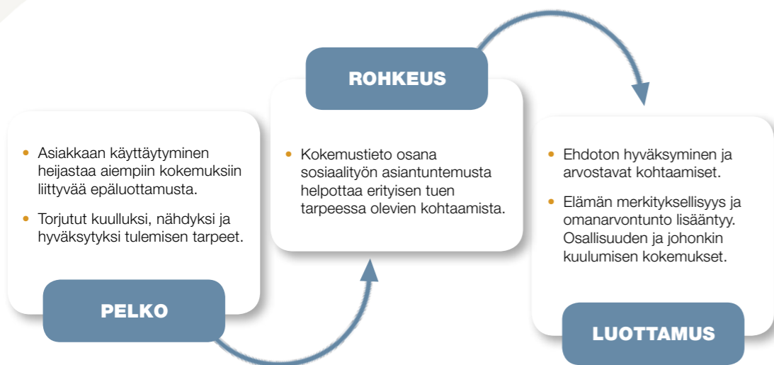
Kuvio 1. Kokemustieto osana kristillisten päihdejärjestöjen asiantuntemusta.

Vailla kannattelevaa lähiyhteisöä elävillä, erityisen tuen tarpeessa olevilla ihmisillä on paljon sellaisia rakkauden, omanarvontunnon ja elämän tarkoituksellisuuden tiedostamattomiakin tarpeita, joihin julkisen palvelujärjestelmän on hyvin vaikea vastata. Kristillisten päihdejärjestöjen kokonaisvaltainen ihmiskäsitys ja arvostavan kohtaamisen eetos voivat mahdollistaa vastaamisen myös muihin kuin selkeästi muotoiltaviin ”palvelutarpeisiin”. Oletettavasti auttamistyötä tekevien omaksumalla arvopohjalla, ihmiskäsityksellä ja työn eetoksella on suuri merkitys sille, että ihmisarvot eivät jää vain mekaanisiksi suorituksiksi, vaille syvällisempää vaikuttavuutta ihmisen minäkuvaan. Jotta toivonsa ja luottamuksensa menettänyt voisi kokea olevansa ”oikeasti olemassa” ja kyetä näkemään itsensä arvokkaana, on jonkun toisen ensin osoitettava hänelle hyväksyntää, välittämistä ja rakkaudellisuutta paitsi sanoilla, erityisesti teoilla, katseella ja kosketuksella. 12