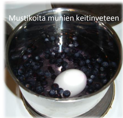
Mustikoita munien keitinveeseen