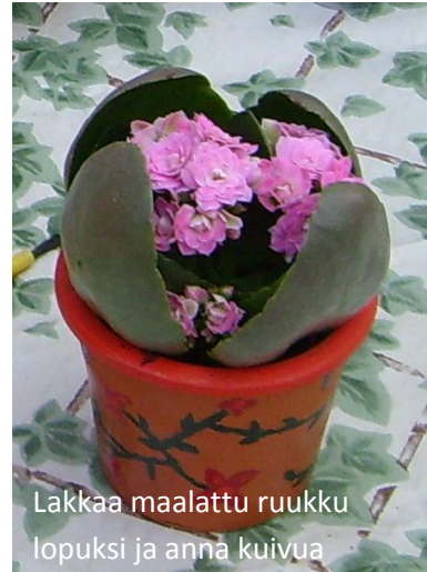
Lakkaa maalattu ruukku lopuksi ja anna kuivua