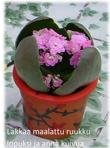
Lakkaa maalattu ruukku lopuksi ja anna kuivua