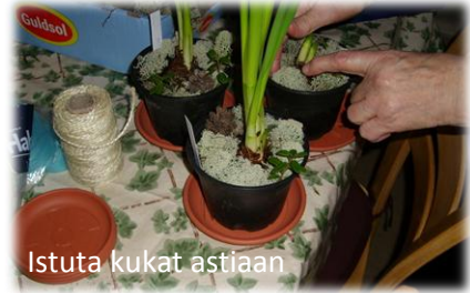
Istuta kukat astiaan