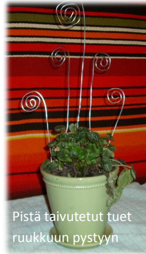
Pistä taivutetut tuet ruukkuun pystyyn