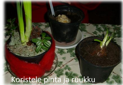
Koristele pinta ja ruukku