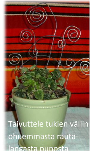
Taivuttele tukien väliin ohuemmassa rautalangasta punosta