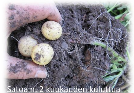
Satoa n. 2 kuukauden kuluttua