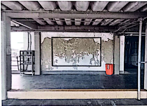
Figura 05 – Instalação de banner no mirante da ETA-GUANDU. A moldura tem dimensão 2,85 metros de comprimento x 1,80 metro de altura. A empresa contratada será responsável pela recuperação de toda estrutura metálica.