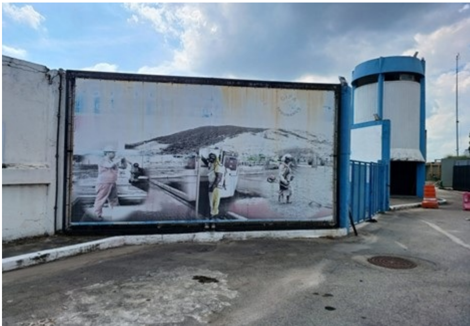
Figura 05 – Instalação de banner no mirante da ETA-GUANDU. A moldura tem dimensão 2,85 metros de comprimento x 1,80 metro de altura. A empresa contratada será responsável pela recuperação de toda estrutura metálica.