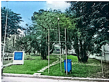
Figura 03 – Instalação de banner na avenida principal da ETA-GUANDU. A moldura tem dimensão 1,50 metro de comprimento x 1,80 metro de altura. A empresa contratada será responsável pela recuperação de toda estrutura metálica. Será fornecido e instalado relé fotocélula e 01 (um) refletor 150w; bifásico; tensão: 110/220v; fluxo luminoso no mínimo 15000 lúmens; temperatura da cor no mínimo 5000k; grau de proteção ip-65; fixação: braço metálico até 60mm de diâmetro; com certificação do Inmetro. referência: fortlight - modelo fleed ss09 150w.