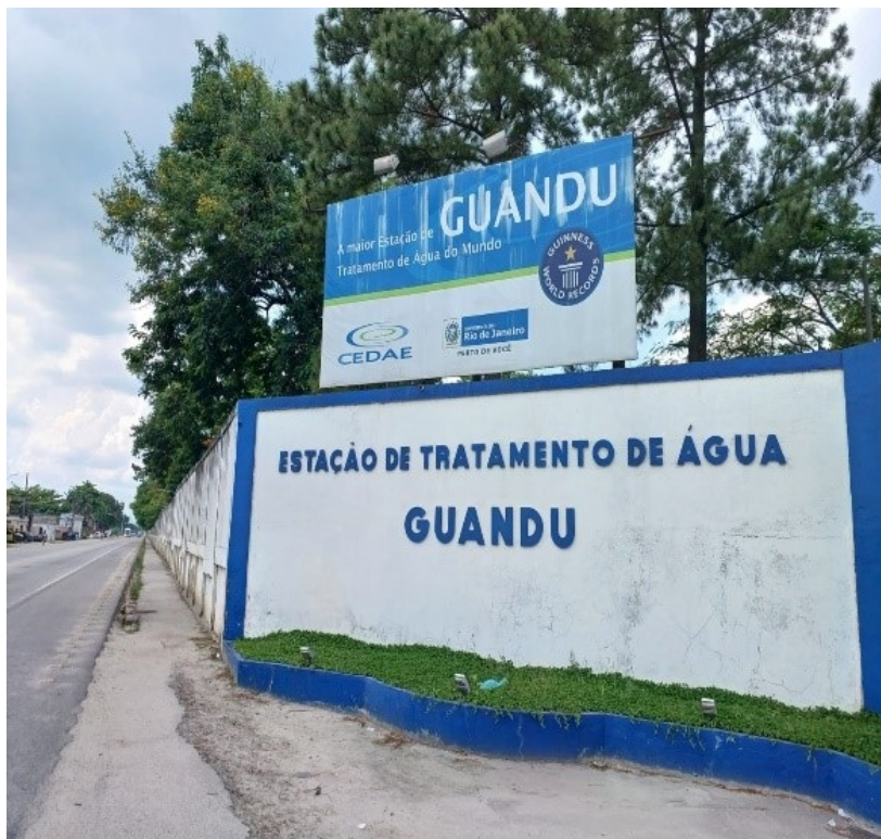
Figura 01 – Substituição do banner localizado na portaria principal da ETA-GUANDU. A moldura tem dimensão 5,90 metros de comprimento x 3,20 metros de altura. A empresa contratada será responsável pela recuperação de toda estrutura metálica. Será fornecido e instalado relé fotocélula e 03 (três) refletores 150w; bifásico; tensão: 110/220v; fluxo luminoso no mínimo 15000 lúmens; temperatura da cor no mínimo 5000k; grau de proteção ip-65; fixação: braço metálico até 60mm de diâmetro; com certificação do Inmetro. referência: fortlight - modelo fled ss09 150w.

acabamento. Abaixo, seguem os locais de instalação dos banners.