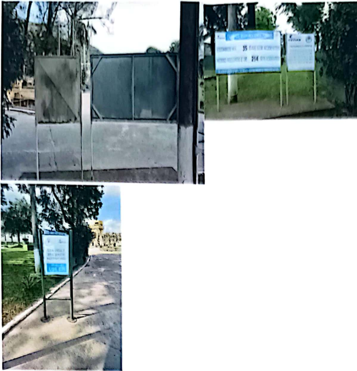
Figura 06 – Substituição de 03 placas metálicas ao lado da portaria principal. As placas nas dimensões de 2,00 metros x 1,00 metro, 0,95 metro x 0,95 metro e 0,80 metro x 0,60 metro. A contratada deverá fornecer 03 unidades de cada número na sequência de 0 a 9.