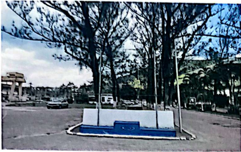
Figura 02 – Instalação de banner em frente à portaria principal da ETA-GUANDU. A moldura tem dimensão 3,30 metros de comprimento x 2,70 metros de altura. . A empresa contratada será responsável pela recuperação de toda estrutura metálica. Será fornecido e instalado relé fotocélula e 01 (um) refletor 150w; bifásico; tensão: 110/220v; fluxo luminoso no mínimo 15000 lúmens; temperatura da cor no mínimo 5000k; grau de proteção ip-65; fixação: braço metálico até 60mm de diâmetro; com certificação do inmetro. referência: fortlight - modelo fleed ss09 150w.