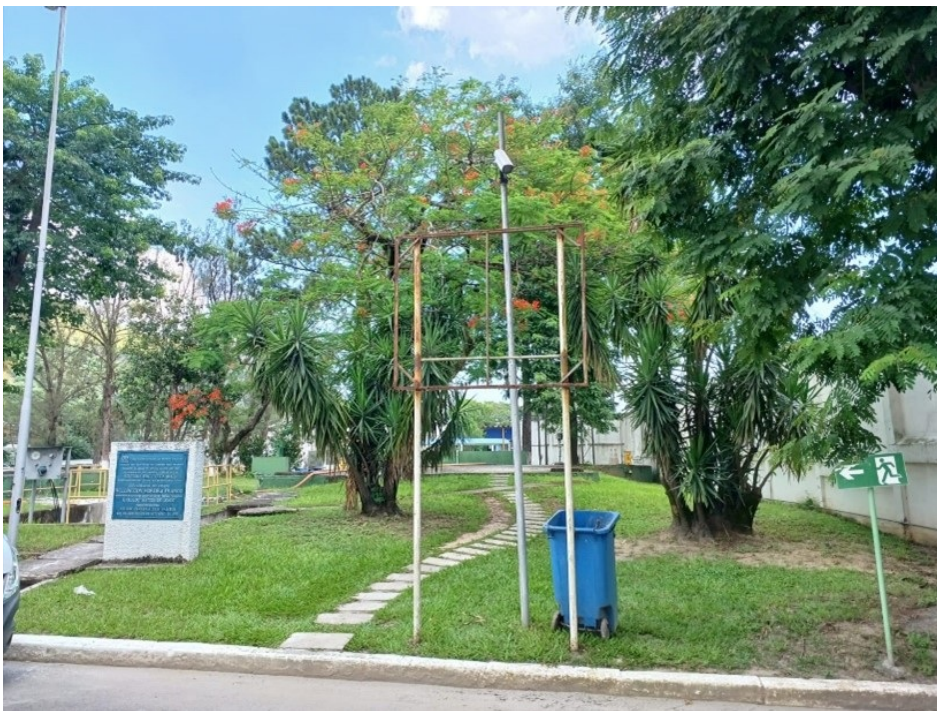
Figura 04 – Instalação de banner próxima ao estacionamento do prédio da gerência da ETA-GUANDU. A moldura tem dimensão 5,70 metros de comprimento x 3,50 metros de altura. A empresa contratada será responsável pela recuperação de toda estrutura metálica. Será fornecido e instalado relé fotocélula e 03 (três) refletores 150w; bifásico; tensão: 110/220v; fluxo luminoso no mínimo 15000 lúmens; temperatura da cor no mínimo 5000k; grau de proteção ip-65; fixação: braço metálico até 60mm de diâmetro; com certificação do Inmetro. referência: fortlight - modelo fleed ss09 150w.

Figura 03 – Instalação de banner na avenida principal da ETA-GUANDU. A moldura tem dimensão 1,50 metro de comprimento x 1,80 metro de altura. A empresa contratada será responsável pela recuperação de toda estrutura metálica. Será fornecido e instalado relé fotocélula e 01 (um) refletor 150w; bifásico; tensão: 110/220v; fluxo luminoso no mínimo 15000 lúmens; temperatura da cor no mínimo 5000k; grau de proteção ip-65; fixação: braço metálico até 60mm de diâmetro; com certificação do Inmetro. referência: fortlight - modelo fleed ss09 150w.