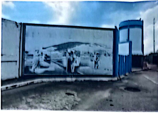
Figura 04 – Instalação de banner próxima ao estacionamento do prédio da gerência da ETA-GUANDU. A moldura tem dimensão 5,70 metros de comprimento x 3,50 metros de altura. A empresa contratada será responsável pela recuperação de toda estrutura metálica. Será fornecido e instalado relé fotocélula e 03 (três) refletores 150w; bifásico; tensão: 110/220v; fluxo luminoso no mínimo 15000 lúmens; temperatura da cor no mínimo 5000k; grau de proteção ip-65; fixação: braço metálico até 60mm de diâmetro; com certificação do Inmetro. referência: forlight - modelo fleed ss09 150w.