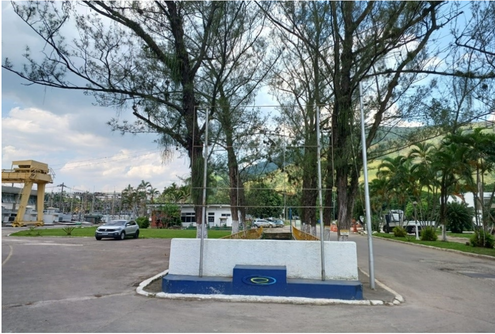
Figura 03 – Instalação de banner na avenida principal da ETA-GUANDU. A moldura tem dimensão 1,50 metro de comprimento x 1,80 metro de altura. A empresa contratada será responsável pela recuperação de toda estrutura metálica. Será fornecido e instalado relé fotocélula e 01 (um) refletor 150w; bifásico; tensão: 110/220v; fluxo luminoso no mínimo 15000 lúmens; temperatura da cor no mínimo 5000k; grau de proteção ip-65; fixação: braço metálico até 60mm de diâmetro; com certificação do Inmetro. referência: fortlight - modelo fleed ss09 150w.

150w; bifásico; tensão: 110/220v; fluxo luminoso no mínimo 15000 lúmens; temperatura da cor no mínimo 5000k; grau de proteção ip-65; fixação: braço metálico até 60mm de diâmetro; com certificação do inmetro. referência: fortlight - modelo fleed ss09 150w.