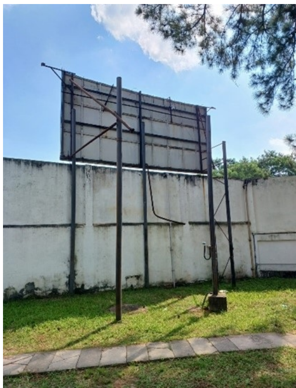
Figura 02 – Instalação de banner em frente à portaria principal da ETA-GUANDU. A moldura tem dimensão 3,30 metros de comprimento x 2,70 metros de altura. . A empresa contratada será responsável pela recuperação de toda estrutura metálica. Será fornecido e instalado relé fotocélula e 01 (um) refletor