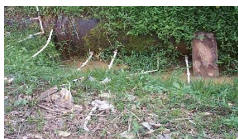
Flagrante de ligações clandestinas em adutora

Na figura a seguir, pode ser observado o furto de água tratada através de ligações clandestinas precárias; fato comum em nossa rede de distribuição e adutoras que comprometem a qualidade da água dos cidadãos que mantêm seu abastecimento regularizado.