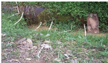
Flagrante de ligações clandestinas em adutora. Evite e denuncie o "gato", ele poderá levar doenças para dentro de sua casa.

Na figura a seguir, pode ser observado o furto de água tratada através de ligações clandestinas precárias; fato comum em nossa rede de distribuição e adutoras que comprometem a qualidade da água dos cidadãos que mantêm seu abastecimento regularizado.