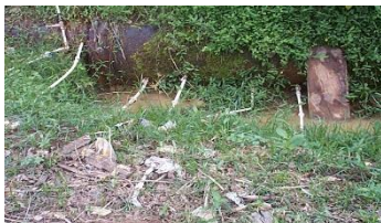
Flagrante de ligações clandestinas em adutora

Na figura a seguir, pode ser observado o furto de água tratada através de ligações clandestinas precárias; fato comum em nossa rede de distribuição e adutoras que comprometem a qualidade da água dos cidadãos que mantêm seu abastecimento regularizado.