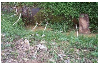
Flagrante de ligações clandestinas em adutora

Na figura a seguir, pode ser observado o furto de água tratada através de ligações clandestinas precárias; fato comum em nossa rede de distribuição adutoras que comprometem a qualidade da água dos cidadãos que mantêm seu abastecimento regularizado.