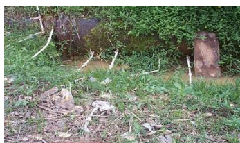
Flagrante de ligações clandestinas em adutora

Na figura a seguir, pode ser observado o furto de água tratada através de ligações clandestinas precárias; fato comum em nossa rede de distribuição e adutoras que comprometem a qualidade da água dos cidadãos que mantêm seu abastecimento regularizado.