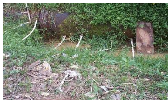
Flagrante de ligações clandestinas em adutora

Na figura a seguir, pode ser observado o furto de água tratada através de ligações clandestinas precárias; fato comum em nossa rede de distribuição e adutoras que comprometem a qualidade da água dos cidadãos que mantêm seu abastecimento regularizado.