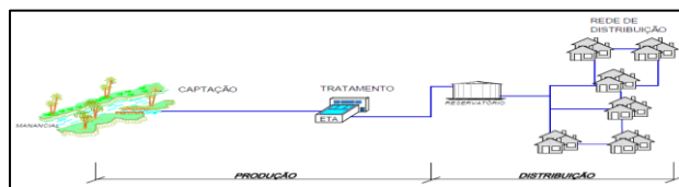
FIGURA 1 - ESQUEMA SIMPLIFICADO DE UM SISTEMA DE ABASTECIMENTO