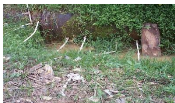
Flagrante de ligações clandestinas em adutora

Na figura a seguir, pode ser observado o furto de água tratada através de ligações clandestinas precárias; fato comum em nossa rede de distribuição e adutoras que comprometem a qualidade da água dos cidadãos que mantêm seu abastecimento regularizado.