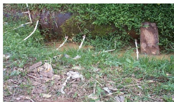
Flagrante de ligações clandestinas em adutora

Na figura a seguir, pode ser observado o furto de água tratada através de ligações clandestinas precárias; fato comum em nossa rede de distribuição e adutoras que comprometem a qualidade da água dos cidadãos que mantêm seu abastecimento regularizado.