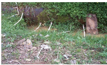
Flagrante de ligações clandestinas em adutora

Na figura a seguir, pode ser observado o furto de água tratada através de ligações clandestinas precárias; fato comum em nossa rede de distribuição e adutoras que comprometem a qualidade da água dos cidadãos que mantêm seu abastecimento regularizado.