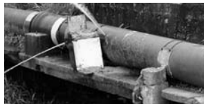
Flagrante de ligações clandestinas em adutora

As principais causas para esse tipo de ocorrência são: avarias na tubulação provocadas por obras (de prefeituras e de concessionárias), manutenção de rede e troca de tubulações, despressurização da rede devido à parada do sistema por falta de energia elétrica e, no topo da lista, as ligações clandestinas. O furto de água, além de causar enormes prejuízos à Companhia, é criminoso por constituir ato ilegal e por colocar em risco a saúde da população, devendo ser, por este motivo, evitado e denunciado.