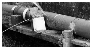
Flagrante de ligações clandestinas em adutora

As principais causas para esse tipo de ocorrência são: avarias na tubulação provocadas por obras (de prefeituras e de concessionárias), manutenção de rede e troca de tubulações, despressurização da rede devido à parada do sistema por falta de energia elétrica e, no topo da lista, as ligações clandestinas. O furto de água, além de causar enormes prejuízos à Companhia, é criminoso por constituir ato ilegal e por colocar em risco a saúde da população, devendo ser, por este motivo, evitado e denunciado.