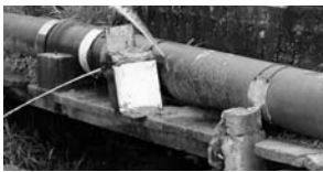
Flagrante de ligações clandestinas em adutora

Na figura a seguir, pode ser observado o furto de água tratada através de ligações clandestinas precárias; fato comum em nossa rede de distribuição e adutoras que comprometem a qualidade da água dos cidadãos que mantêm seu abastecimento regularizado.