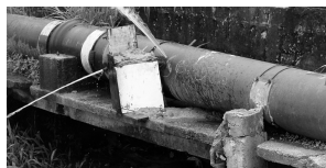
Flagrante de ligações clandestinas em adutora

As principais causas para esse tipo de ocorrência são: avarias na tubulação provocadas por obras (de prefeituras e de concessionárias), manutenção de rede e troca de tubulações, despressurização da rede devido à parada do sistema por falta de energia elétrica e, no topo da lista, as ligações clandestinas. O furto de água, além de causar enormes prejuízos à Companhia, é criminoso por constituir ato ilegal e por colocar em risco a saúde da população, devendo ser, por este motivo, evitado e denunciado.