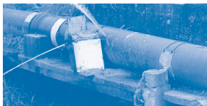
Flagrante de ligações clandestinas em adutora. Evite e denuncie o "gato", ele poderá levar doença para dentro de sua casa.

Na figura a seguir, pode ser observado o furto de água tratada através de ligações clandestinas precárias; fato comum em nossa rede de distribuição e adutoras que comprometem a qualidade da água dos cidadãos que mantêm seu abastecimento regularizado.