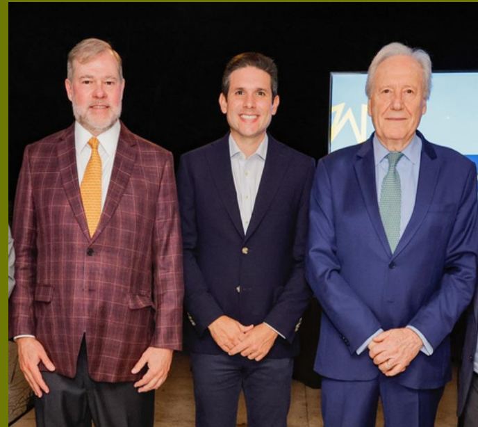
DIAS TOFFOLI, HUGO MOTTA E RICARDO LEWANDOWSKI