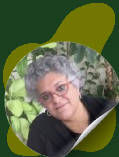
Isabela Texeira Ex - Ministra MMA