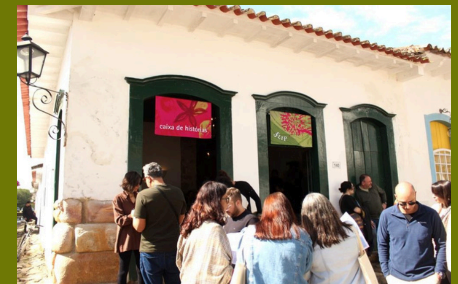
CAIXA DE HISTÓRIAS, FLIP 2025