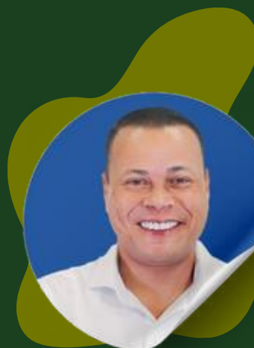
César Nascimento Prefeito de Cubatão