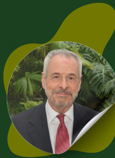
André Corrêa Lago Presidente da COP 30