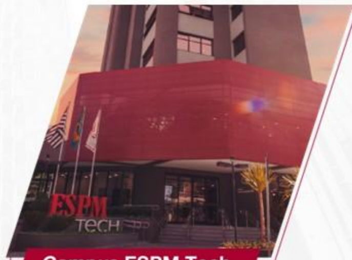
Campus ESPM Tech