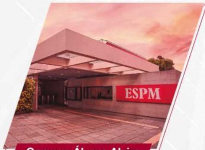
Campus Álvaro Alvim