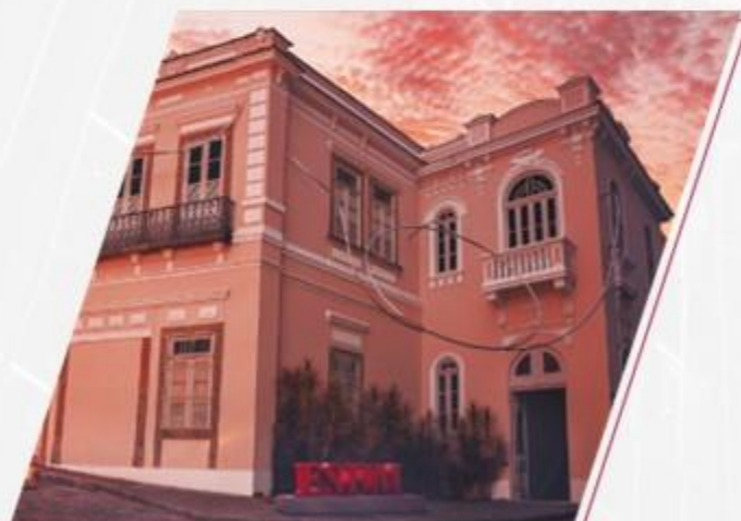
Campus Glória-Villa Aymoré