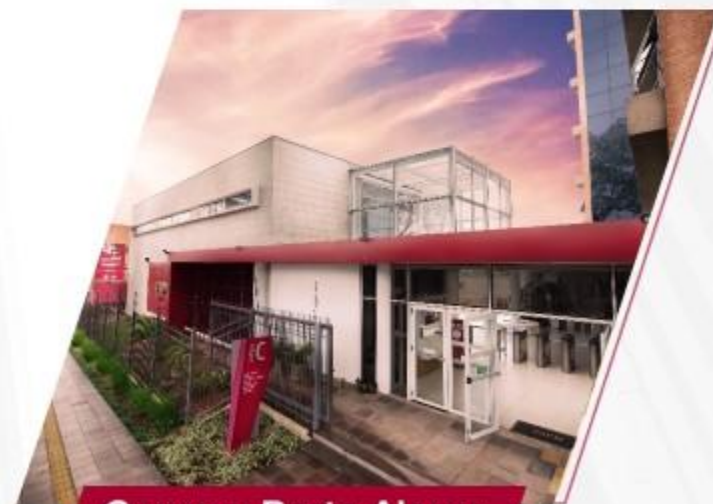
Campus Porto Alegre