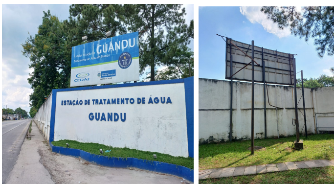
Figura 02 – Instalação de banner em frente à portaria principal da ETA-GUANDU. A moldura tem dimensão 3,30 metros de comprimento x 2,70 metros de altura. . A empresa contratada será responsável pela recuperação de toda estrutura metálica. Será fornecido e instalado relé fotocélula e 01 (um) refletor 150w; bifásico; tensão: 110/220v; fluxo luminoso no mínimo 15000 lúmens; temperatura da cor no mínimo 5000k; grau de proteção ip-65; fixação: braço metálico até 60mm de diâmetro; com certificação do inmetro. referência: fortlight - modelo fleed ss09 150w.

Figura 01 – Substituição do banner localizado na portaria principal da ETA-GUANDU. A moldura tem dimensão 5,90 metros de comprimento x 3,20 metros de altura. A empresa contratada será responsável pela recuperação de toda estrutura metálica. Será fornecido e instalado relé fotocélula e 03 (três) refletores 150w; bifásico; tensão: 110/220v; fluxo luminoso no mínimo 15000 lúmens; temperatura da cor no mínimo 5000k; grau de proteção ip-65; fixação: braço metálico até 60mm de diâmetro; com certificação do Inmetro. referência: fortlight - modelo fleed ss09 150w.