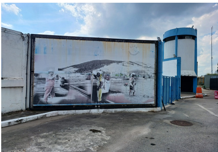
Figura 05 – Instalação de banner no mirante da ETA-GUANDU. A moldura tem dimensão 2,85 metros de comprimento x 1,80 metro de altura. A empresa contratada será responsável pela recuperação de toda estrutura metálica.