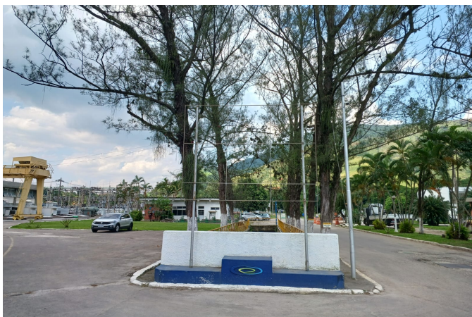
Figura 03 – Instalação de banner na avenida principal da ETA-GUANDU. A moldura tem dimensão 1,50 metro de comprimento x 1,80 metro de altura. A empresa contratada será responsável pela recuperação de toda estrutura metálica. Será fornecido e instalado relé fotocélula e 01 (um) refletor 150w; bifásico; tensão: 110/220v; fluxo luminoso no mínimo 15000 lúmens; temperatura da cor no mínimo 5000k; grau de proteção ip-65; fixação: braço metálico até 60mm de diâmetro; com certificação do Inmetro. referência: fortnight- modelo fleed ss09 150w.