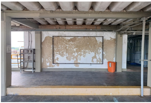
Figura 06 – Substituição de 03 placas metálicas ao lado da portaria principal. As placas nas dimensões de 2,00 metro x 1,00 metro, 0,95 metro x 0,95 metro e 0,80 metro x 0,60 metro. A contratada deverá fornecer 03 unidades de cada número na sequência de 0 a 9.