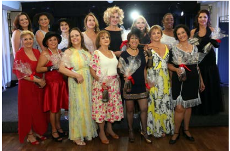
As divas minastenistas foram presenteadas com uma garrafa de espumante