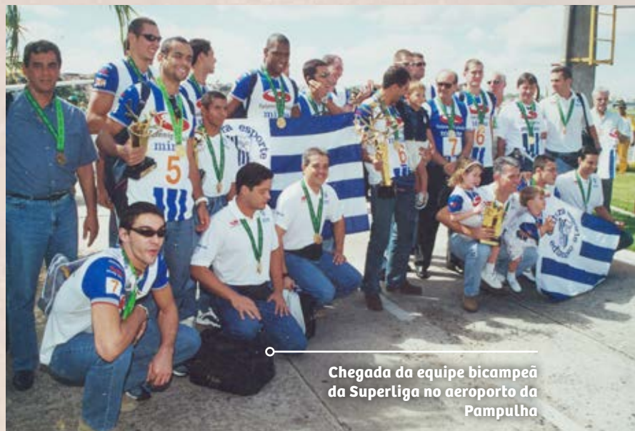
Chegada da equipe bicampeã da Superliga no aeroporto da Pampulha