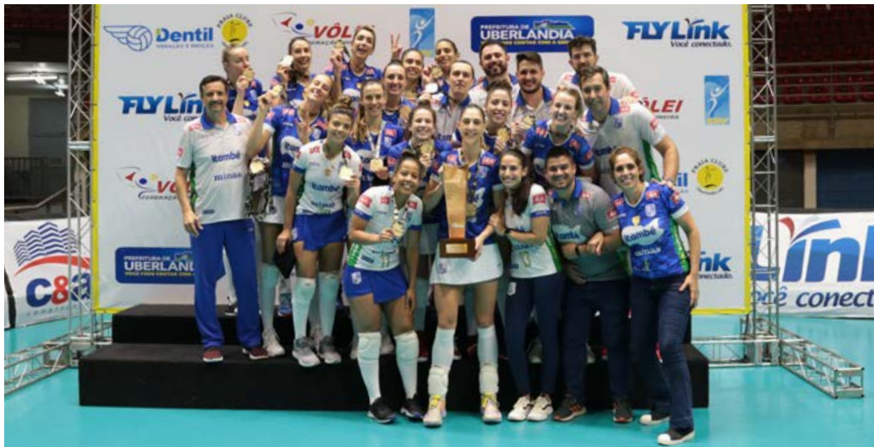
Itambé/Minas celebra o título na Arena Sabiazinho

Itambé/Minas conquista o Sul-americano pela quinta vez e a vaga para o Mundial