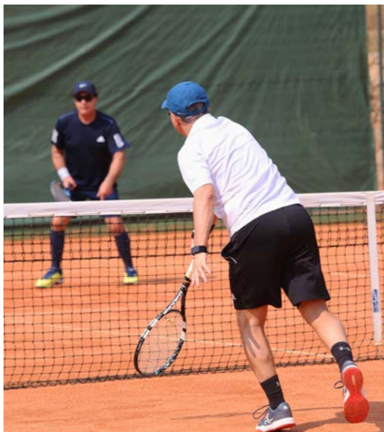
O Minas Náutico tem novo Curso de Tênis para crianças e adultos

Mais informações, na Central de Atendimento: 3517-3000.