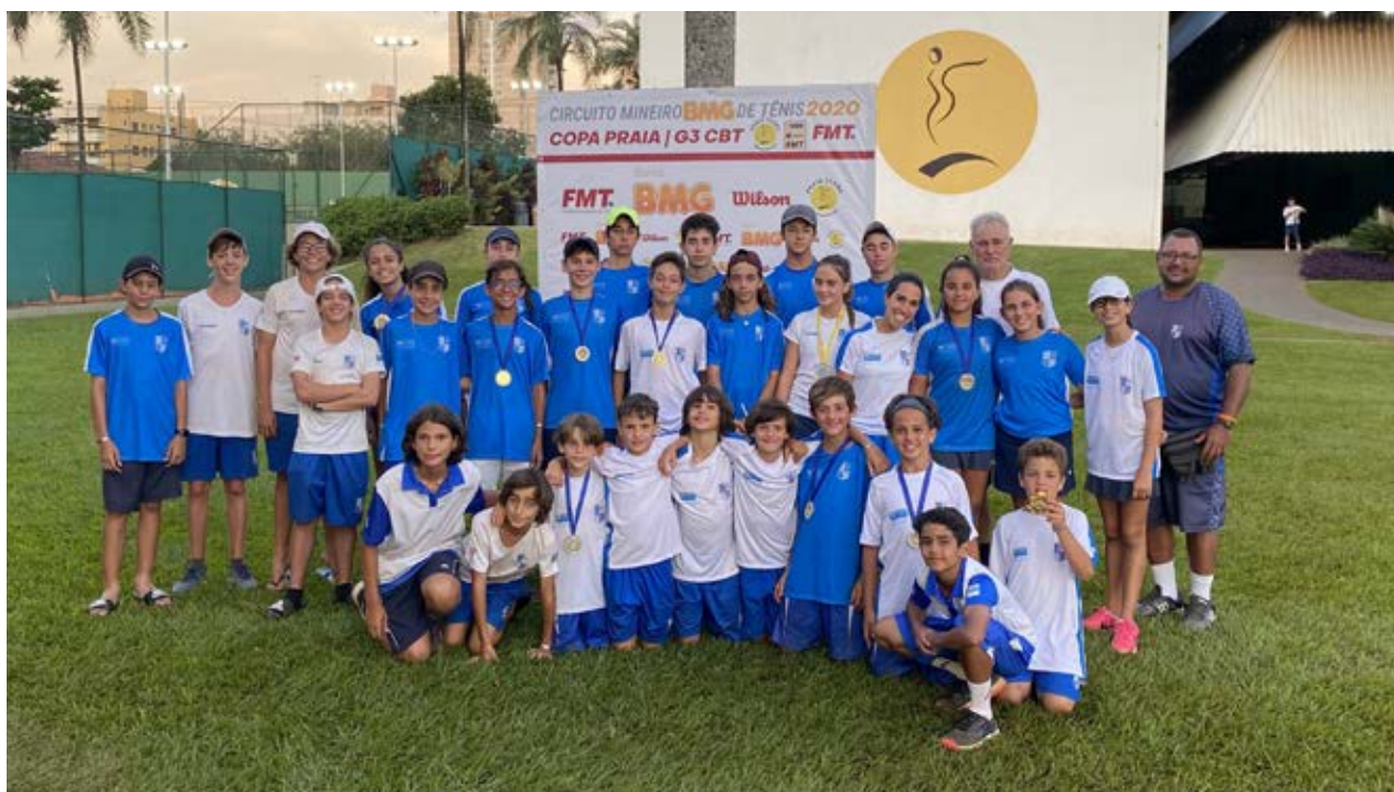
A equipe minastenista faturou 11 troféus no Torneio Estadual FMT 1000

Minastenistas conquistam troféus na disputa do Estadual FMT1000