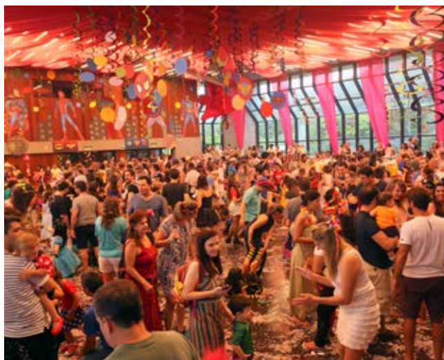
Lotado! Salão do Minas II é o espaço oficial das Matinês de Carnaval do Minas