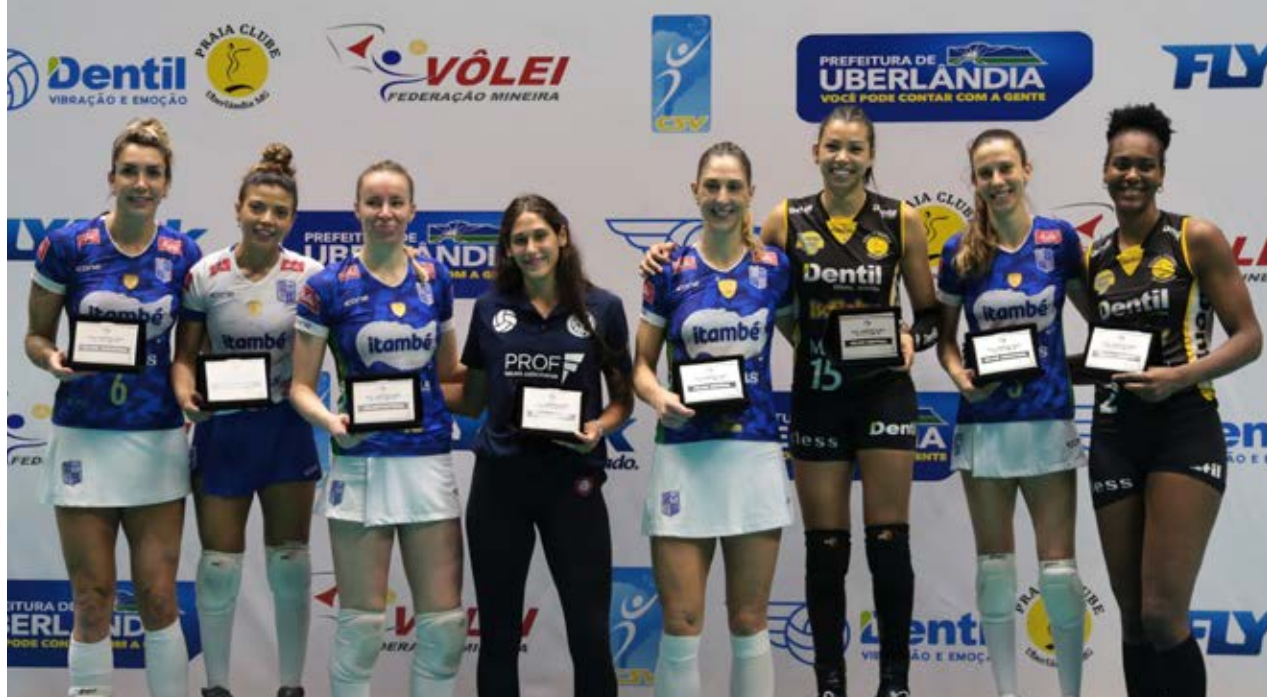
A seleção do campeonato foi dominada por atletas do Itambé/Minas