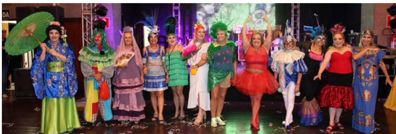
Os “cabeças de prata” esbanjaram criatividade na disputa do Concurso de Fantasia, na categoria Individual