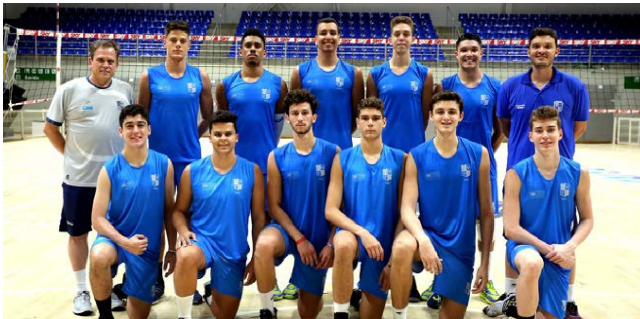
Atletas e técnicos que representaram o Minas nos Brasileiros de Seleções Sub-17 e Sub-19

Minastenistas representam cinco times estaduais nos Brasileiros de Seleções