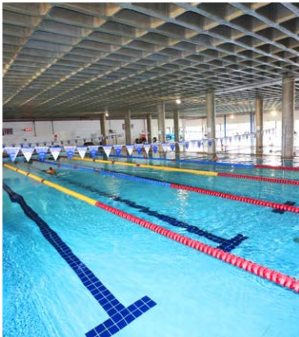
Piscina coberta e aquecida: conforto e comodidade para os alunos do Curso de Natação

Curso de Natação tem aulas em piscinas aquecidas e acessíveis e vagas para bebês