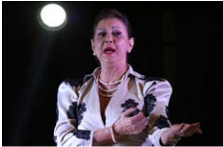
Madonna, a diva do pop mundial, foi homenageada por Vera Cunha, na cena do filme "Evita", de 1996