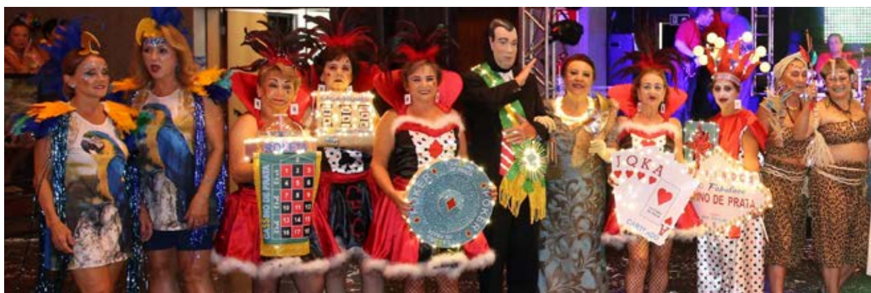
Originalidade nas fantasias e alegria também não faltaram aos grupos participantes do Concurso