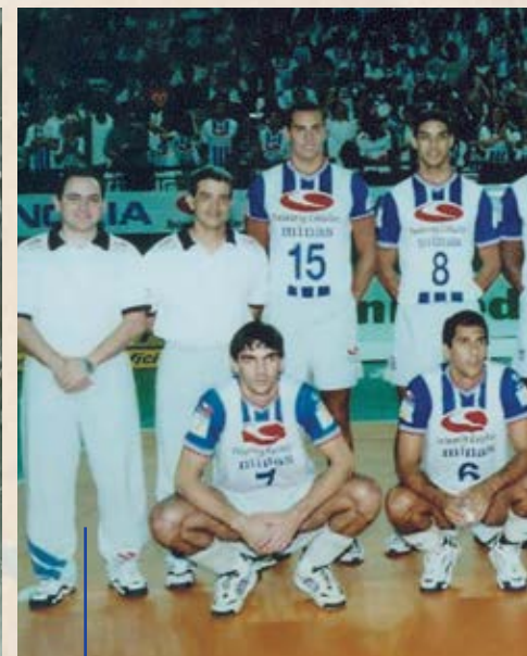
Equipe que conquistou o primeiro título do tricampeonato, na temporada 1999/2000