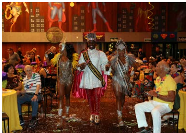
O Rei Momo, a Rainha e a Princesa do Carnaval de Belo Horizonte participaram do Grito de Carnaval do Cabeça de Prata