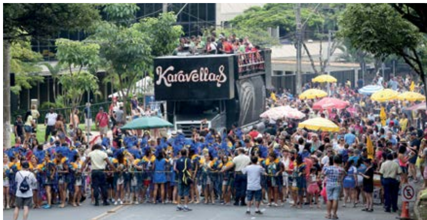
De cima do trio elétrico, a banda Saideira animou os foliões no Bloco do Minas