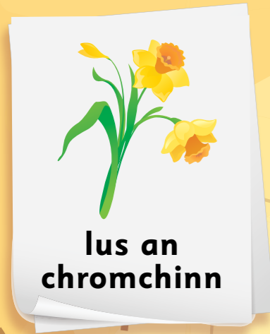
lus an chromchinn